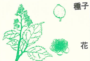
タンナサワフタギ (ハイノキ科)

山地に生える落葉低木、高さ二〜四m、枝は灰白色でネジキのような縦に深い割れ目がある。葉は互生、広倒卵形、長さ四〜九cm、幅二〜五cm、鋭くてやや粗い鋸歯があり先は尾状に鋭くとがる。葉柄は三〜七mm、上面は光沢がなくほとんど無毛又はまばらに毛