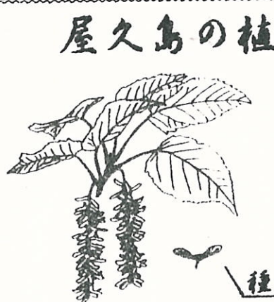
屋久島の植物 ヤクシマオナガカエデ (カエデ科) 種子

屋久島のみ自生する落葉高木、高さ一五m、径五〇cmに達する。樹皮は緑色で縦に黒縞があり、平滑だが老木では浅く縦裂する。葉は対生し、卵形又は卵状広た円形、長さ七〜一四cm、不整鋸歯縁をなし、ときに五裂し、上面は深緑色、下面は淡緑色でやや灰白色を帯びる。開花は三月四月、一対の葉をともなつた総状下序を頂生下垂し、雄花と両性花を別株に生ずる。材は黄白色、軽軟で経木、箱くり物などに用いられる。