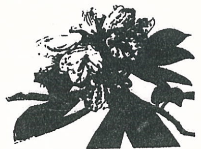
ヤクシマシヤクナゲ

樹形剛直、葉は有柄で小判形、縁辺が内曲し光沢が大きい。長さ七〜一四cm、中二〜三cm、下面に淡褐色の綿毛厚く密生している。花は淡紅色稀に白色に近く、径四〇mm、長さ三五mm、花梗に軟毛あり花冠五裂、オシベ一〇本。今年には花のつきが良く、何十年に一回といわれるヤクシマシヤクナゲの自然庭園が觀賞できそうです。