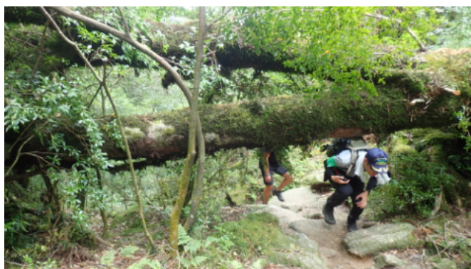
登山ルート上に倒れたヤマグルマ

ます。 【蛇之口滝方面】 天候が不安定だったためか、登山者には1人も出会いませんでしたが、ノシランの開花が見られました。台風の影響により、登山ルート上に倒木があったため、職員で除去を行いました。