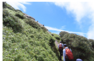
パトロール中の職員