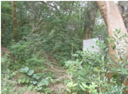
平成28年度のプロット内