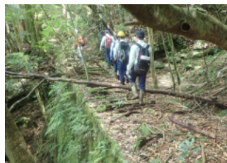
木炭軌道跡を歩く