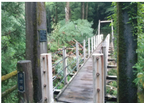
ヤクスギランド清涼橋に流れ込んだ立木

台風6号は、8月8日から9日にかけて強い勢力を保ったまま、屋久島に接近し風雨ともに強く大きな災害をもたらしました。