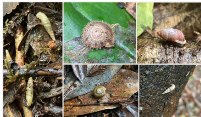
写真2 屋久島で見られるカタツムリたち2