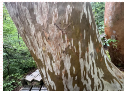
夫婦杉近くのヒメシャラ被害

屋久杉などは数千年かけて生育してきた貴重な樹木でもあり、皆さんで大切に見守りたいものです。登山は、マナーを守って楽しみましょう。