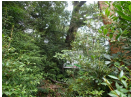
令和3年度のプロット内