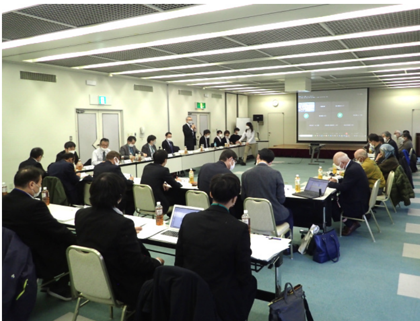
ヤクシカワーキンググループ会場

主な議題は、①令和4年度世界遺産地域モニタリング調査等結果（概要）及び令和5年度世界遺