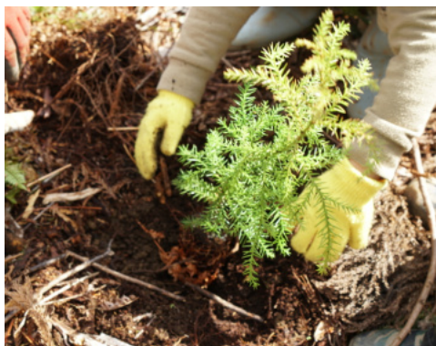
杉のあかちゃん 3歳の苗