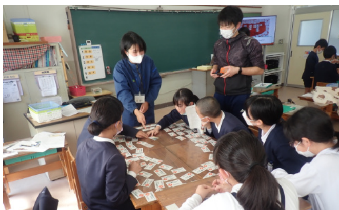
「シカと森のカード」ゲームに挑戦する児童たち

最後に、代表の児童から感謝の言葉をいただき、安房小学校森林教室のプログラムは終了しました。