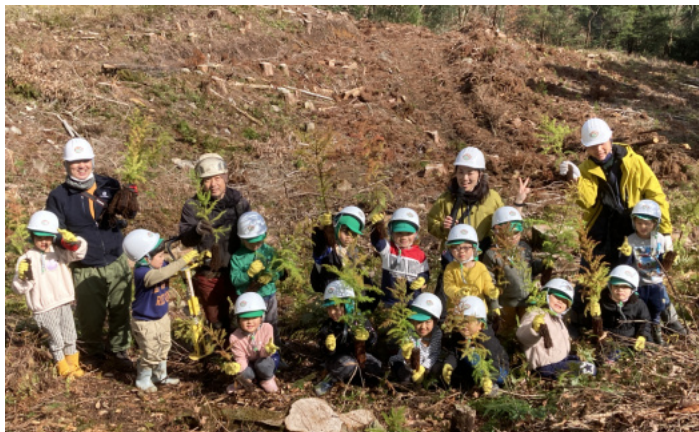
「大きくなってね」と声をかける園児達

次の活動は、木工体験。屋久島で生まれ育った様々な樹種にふれてもらう体験を予定している。40年後、また子ども達と一緒に成長したこの木々に会いに行きたい。