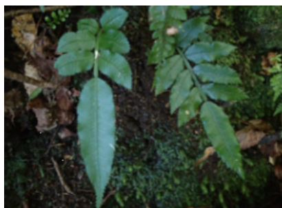
矮小化して生育するリュウビンタイ