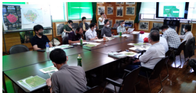
高層湿原対策の意見交換