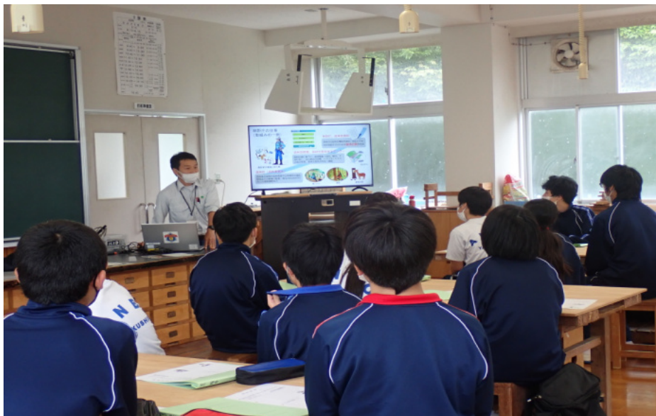
林野庁の業務についての説明

後半はヤクシカの被害状況とその対策をテーマに講話を行いました。説明の中で被害を減らす取り組みの一つとして「罠によるヤクシカの捕獲」を挙げ、生徒たちの前で実物のくくり罠を使い、仕掛け方を解説しました。その後「シカと森林のカード」という遊びながらシカと生物多様性について学べるカードゲームを実施しました。裏返しにしたカードをめくり、動物や樹木のカードを集めて森を作っていくのですが、シカのカードが増えすぎると一部の生き物が全滅してしまうので、