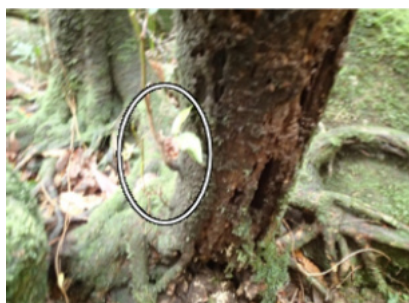
イヌビワに見られた食痕