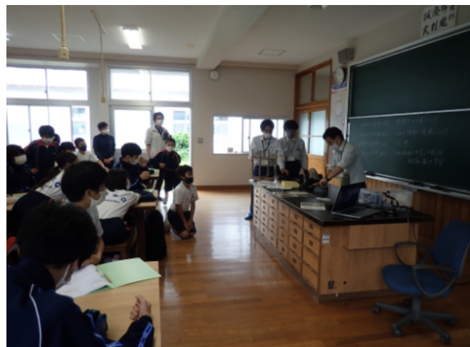
くくり罠の仕掛け方の解説