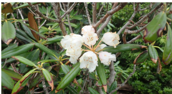
開花したシャクナゲ