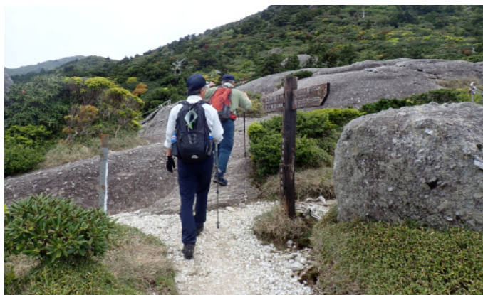
投石平パトロールの様子

今後も地域の関係者と連携しながら、安全で楽しい登山となるよう呼びかけていくこととしています。