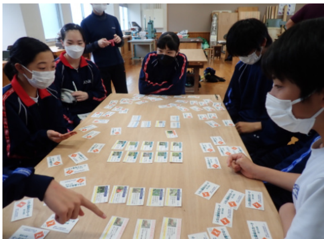
「シカと森林のカード」の実習

この森林教室では、生徒たちに林野庁としての業務や、屋久島の生態系とシカが及ぼす影響について伝えることができました。屋久島環境文化研修センターの皆様とはお互いの環境教育の内容を見学し合い、より学びを深めさせていただきました。今後も、研修センターと連携し、森林教室の質の向上を図ってまいります。