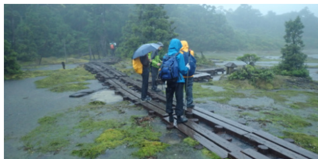
花之江河現地検討会