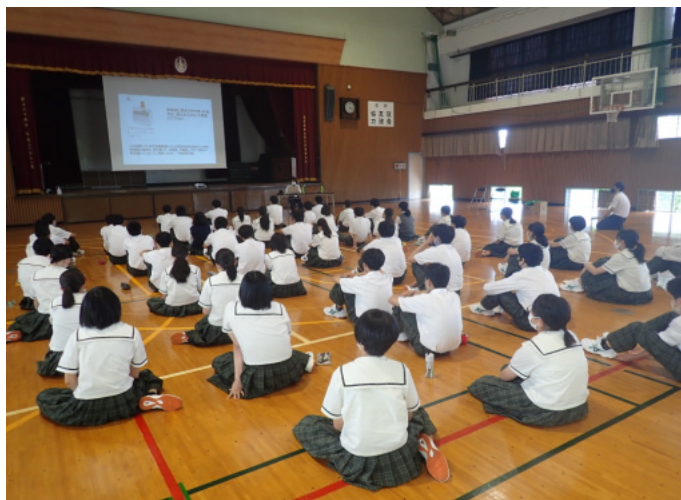
登山マナーについての説明の様子

屋久島高校において、7月に予定されている学校登山を前に、1年生 63名を対象として当保全センター職員による登山マナー等事前指導を行いました。屋久島高校の学校登山は毎年1年生が参加