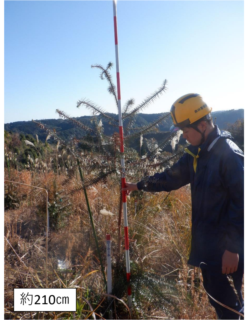
コウヨウザン 広島(中国) 最大個体