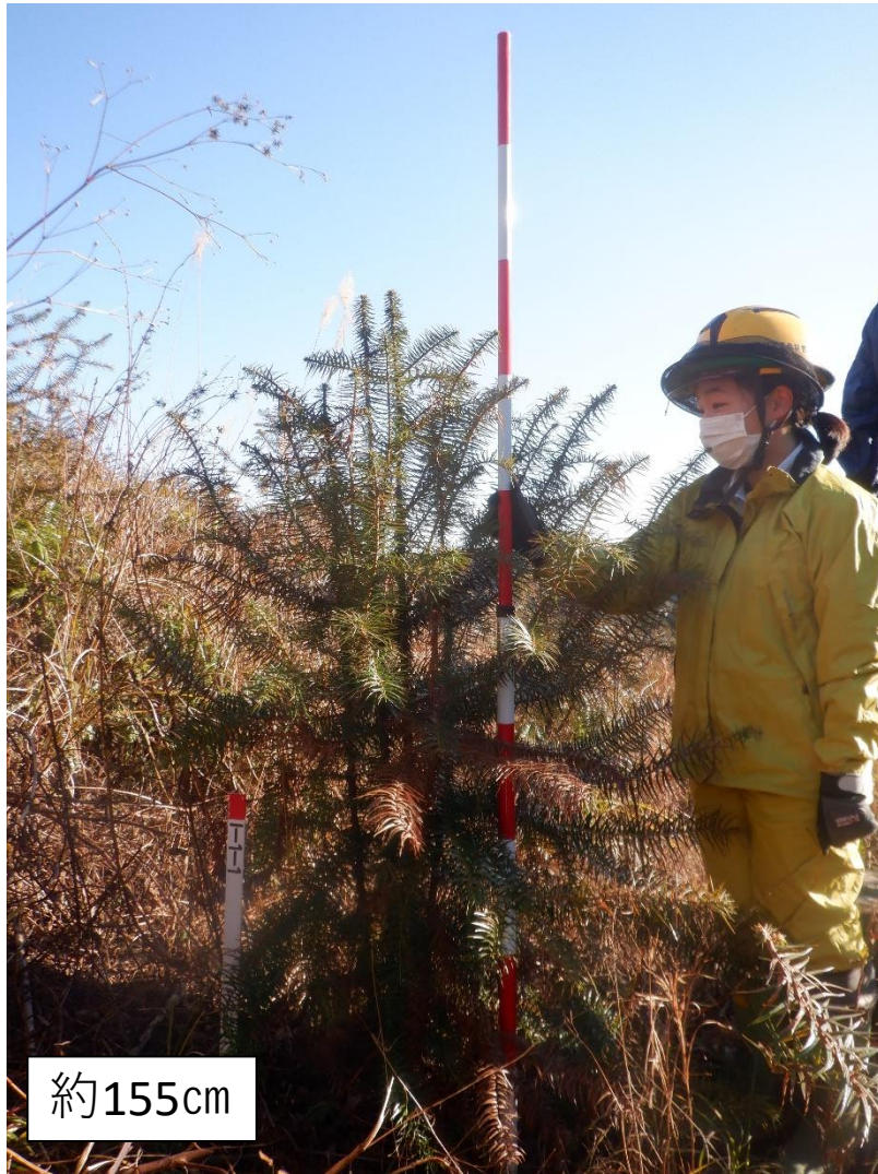
コウヨウザン 京都(大枝A157) 平均個体