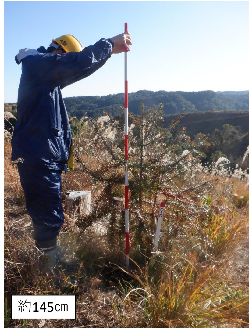
コウヨウザン 京都(大枝A115) 最大個体