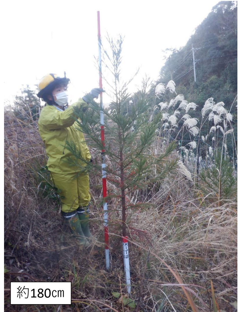
スギ（特定母樹） 県始良20号 平均個体