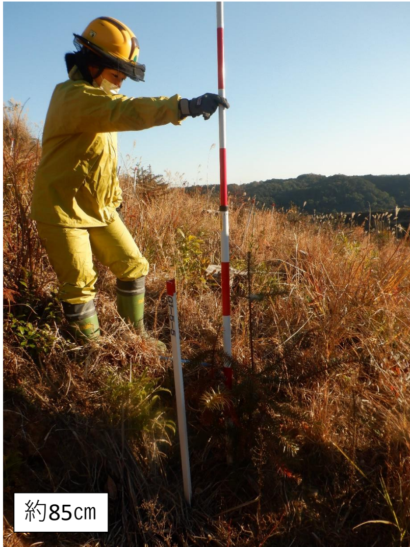
コウヨウザン 広島(中国) 平均個体