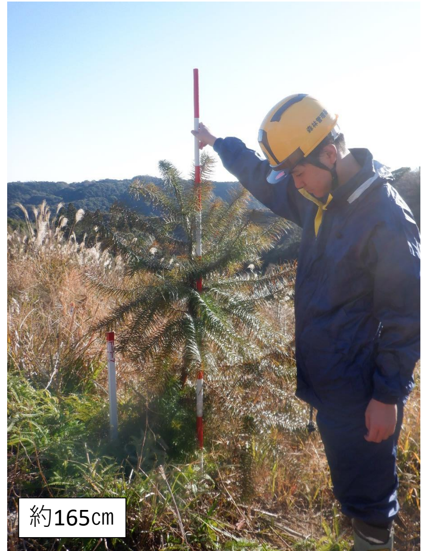
コウヨウザン 四国 平均個体