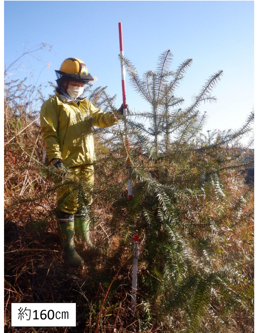
コウヨウザン 京都(大枝A157) 最大個体