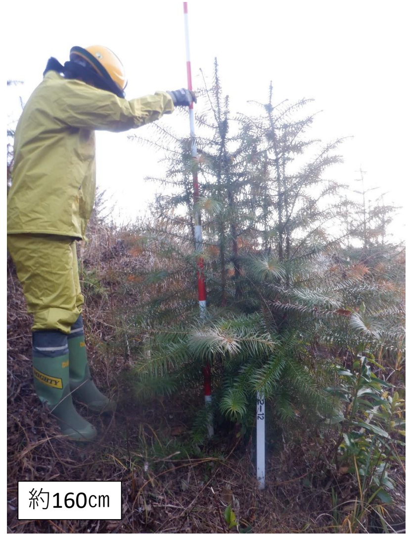
コウヨウザン 鹿児島（福山D279） 平均個体