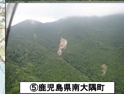
⑤鹿児島県南大隅町