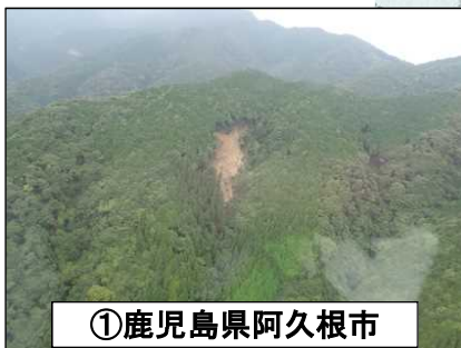
①鹿児島県阿久根市