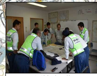
飛行前打合せ状況