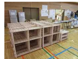
完成(避難世帯数分を制作)