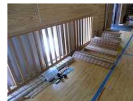
予備材料は切断のうえ金槌・鋸と一緒に手交