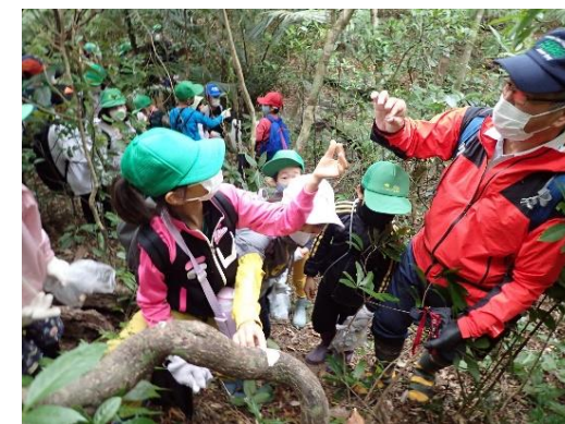
森林環境教育へのフィールド の提供