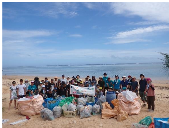
南風見田海岸のビーチクリーン活動

西表島の海岸林や優れた景観を守り自然環境を保全するため、竹富町・地域住民・ボランティア団体等と連携し、海岸林等の清掃やビーチクリーン活動に取り組みます。