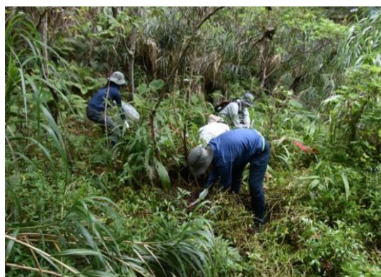
沖縄北部でのアメリカハマグルマの駆除