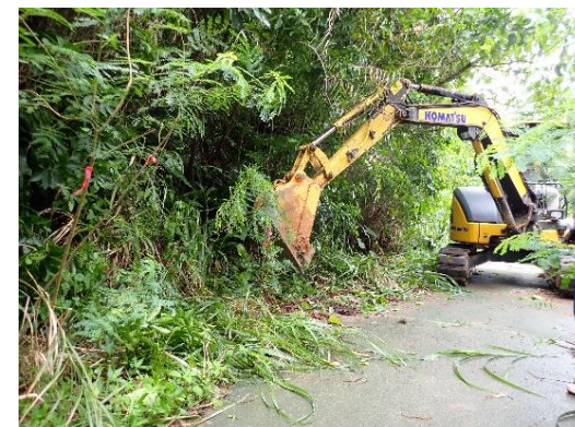
ギンネムの抜き取り駆除