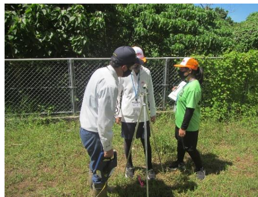
職場体験学習への協力

地元の小・中学生を対象に、職場体験学習への協力や森林環境教育へのフィールド提供等により、人材育成や森林環境教育に取り組めます。