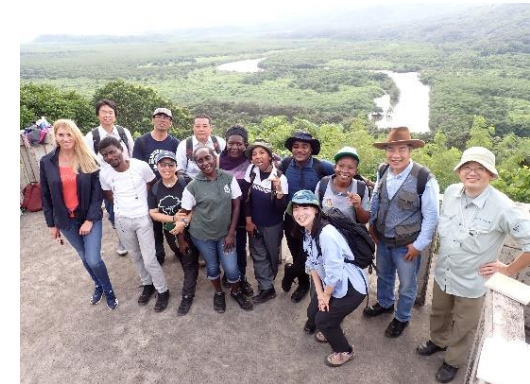
国際協力機構(JICA)による課題別研修