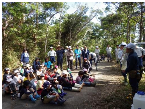
「古事の森」での森林教室

首里城の復元や修復に使用される木材を生産（供給）することを目的に、首里城古事の森育成協議会と連携し、保育作業等を通じて地元小学校等への森林環境教育を実施します。