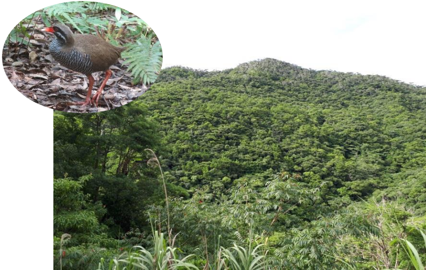
やんばるの森林生態系保護地域 [ヤンバルクイナ]