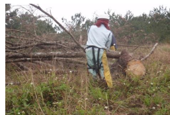
被害木の特別伐倒駆除