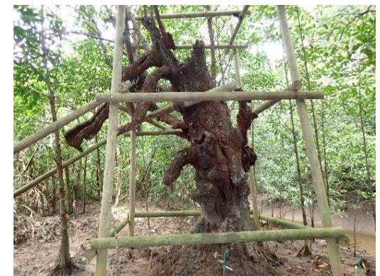
森の巨人たち百選に選定されている ウタラ川のオヒルギ