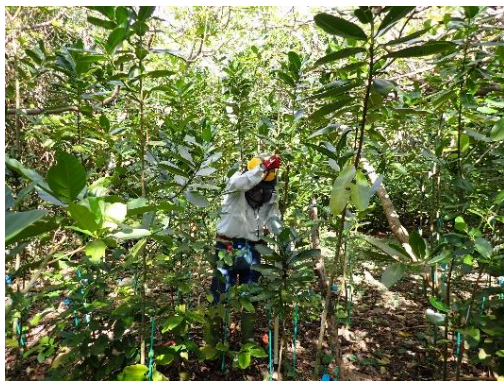
海岸林自然再生試験調査

在来植物による防風・防潮の持続的な機能の発揮が期待できる海岸林の再生、希少種等の保護・増殖等のため、生育状況及び生育環境の経年変化等の把握に取り組みます。