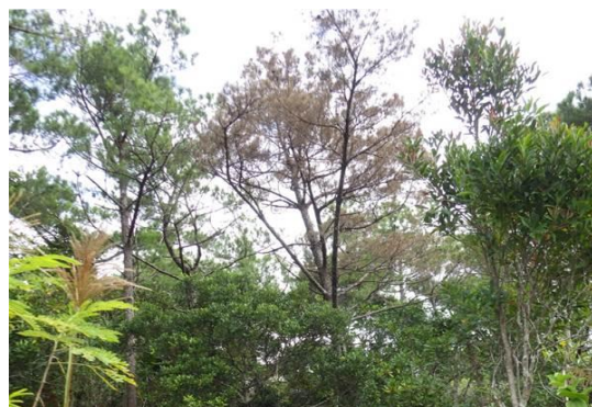
松くい虫被害状況

沖縄県においては、松くい虫被害対策として総合的かつ広域的な被害対策を実施しています。国有林においても松くい虫被害が発生していることから、被害の蔓延防止のための対策について沖縄県等の関係機関と連携し、伐倒駆除による被害対策に取り組めます。