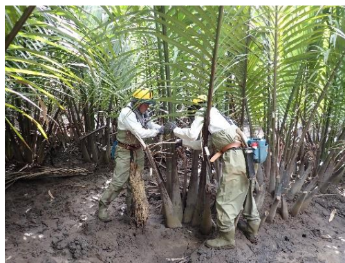
船浦ニツパヤシ希少個体群 保護林の生育調査