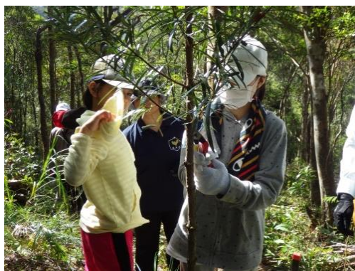
「古事の森」での小学生による 下枝切り