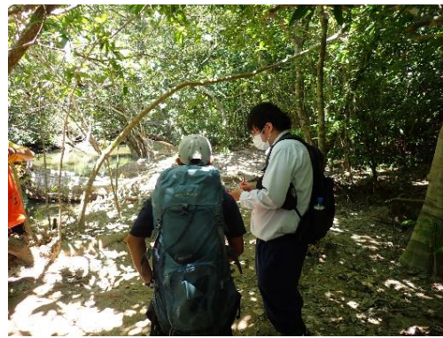
入り込み調査(ヒナイ川)