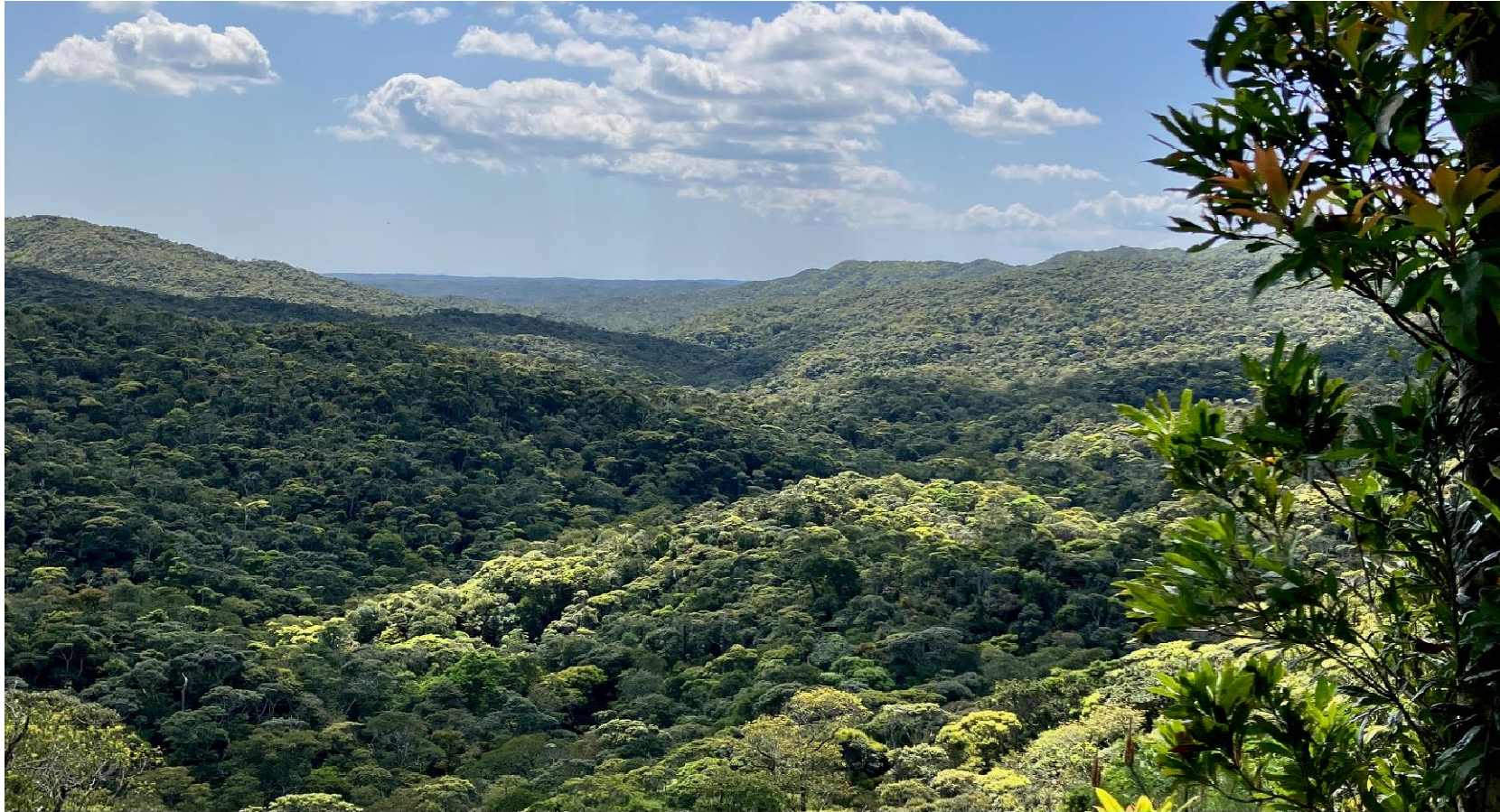
やんばる森林生態系保護地域 遠望