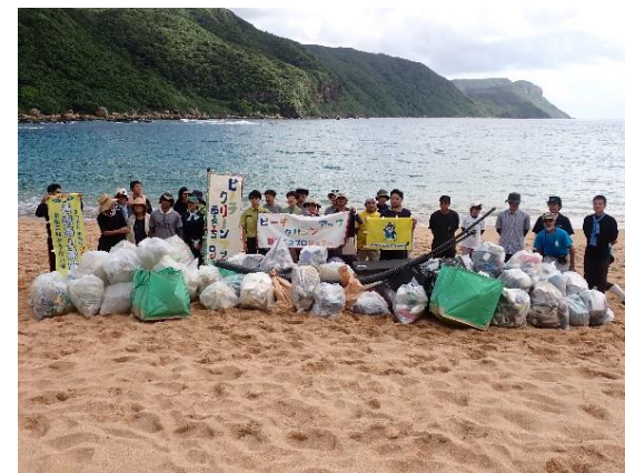
鹿川海岸のビーチクリーン活動