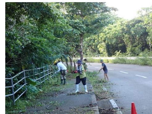
イリオモテヤマネコのロードキル対策(県道の清掃)