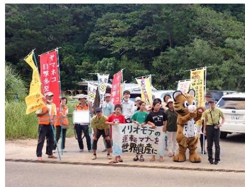
イリオモテヤマネコのロードキル対策(交通安全運動)

イリオモテヤマネコを保全するため、行政機関・地域住民・ボランティア団体等と連携し、県道の環境整備(草刈り)活動等に取り組みます。