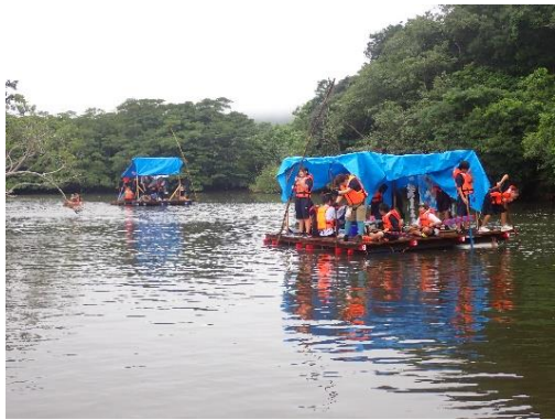
三大行事支援(仲間川筏下り)

竹富町立大原、船浦の両中学校の三大行事支援や地元小・中学生の職場体験学習への協力、ヒナイ川及び西田川を利用するカヤックツアー等の実態調査に取り組みます。