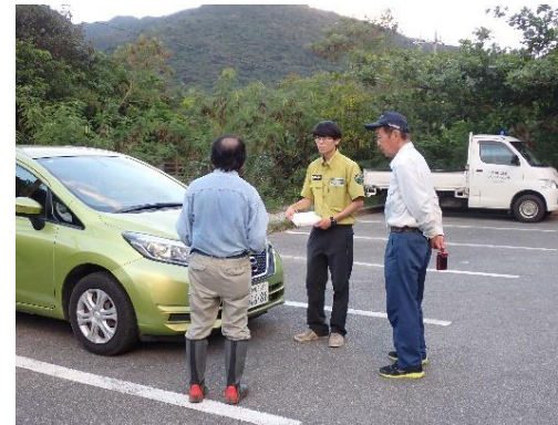
希少野生動植物の密猟・盗掘等防止のための普及啓発活動

関係機関と連携して、希少野生動植物の密猟・盗掘等防止のための普及啓発活動を行います。また、国際協力機構(JICA)が行う生物多様性国際目標に向けた沿岸・海洋生態系保全管理のための研修等への協力に取り組みます。