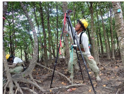
マングローブ林の開空度調査

マングローブ林並びに西表島の巨樹・巨木選定木の保全・保護のため生育状況及び生育環境の経年変化等のモニタリング調査に取り組みます。