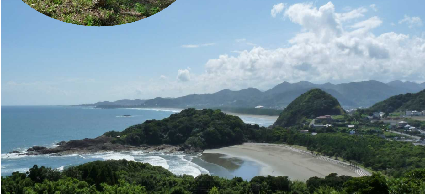
伊勢ヶ浜・お倉ヶ浜海岸