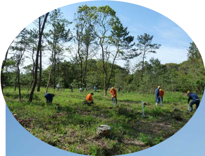
伊勢ヶ浜 ボランティア植樹