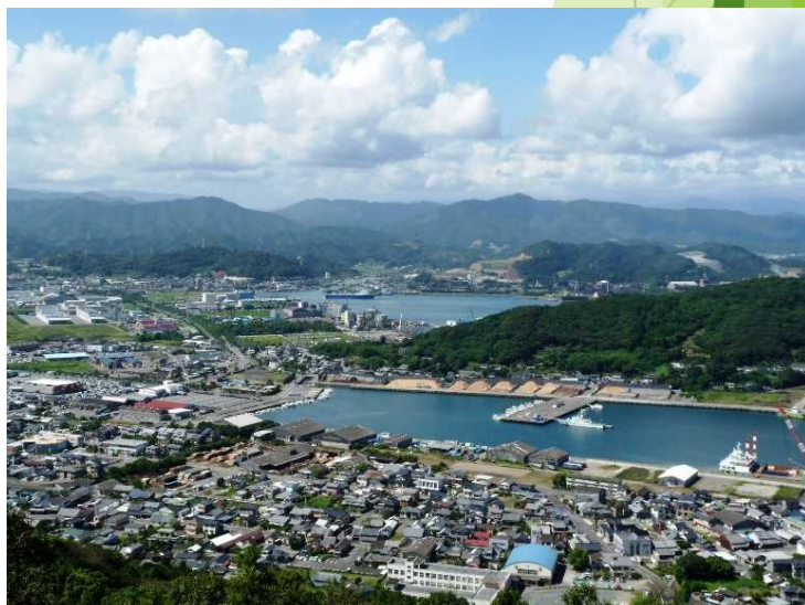
物流の拠点細島港