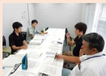
森林整備計画の素案を作成