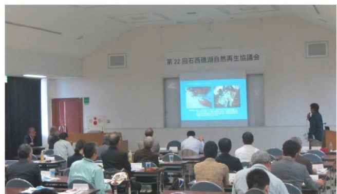
石西礁湖自然再生協議会の様子