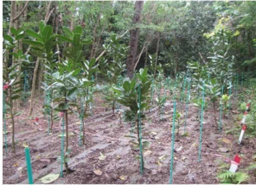
試験地のフクギ・テリハボク

「ギンネム」は、繁茂はするものの、台風等の強風には弱く、幹折れや枝葉の四散で大きな林冠を形成することができないので、防潮・防風機能の持続的な発揮が期待できません。