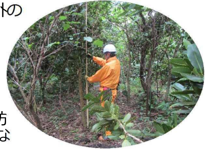
生育状況調査の様子

このことから、海岸林の防風等の機能を高めた豊かな森林に復活させることを目的に海岸林自然再生試験地（調査区1～4）を設定しています。