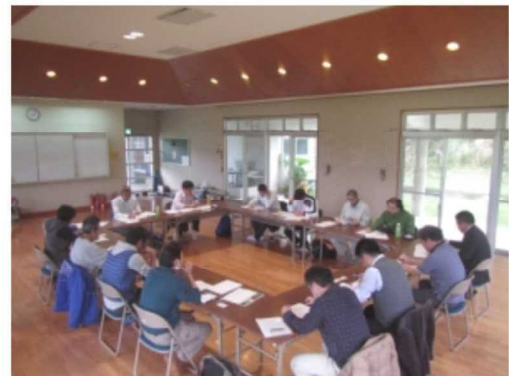
自然環境推進のための連絡会

これらのご意見・ご要望等を踏まえ、支援機関等と調整を図りながら、「自然環境教育カリキュラム」の改訂や支援の実施に向けた検討を進めるとともに、西表島における自然環境教育の一層の推進に取り組んでいきたいと思っております。