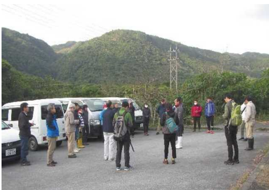
現地視察⑤ 検討会の様子

今後も、本検討会においては、適正ルール及び推進体制等の構築に向け検討が進められる予定ですが、関係機関や地域と連携を図りながら、西表島における各種の検討等に取り組んでいきます。