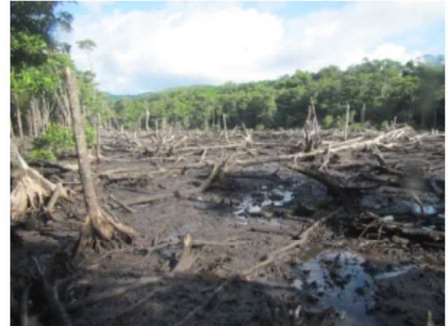
稚樹の発生があまり見られない中流域