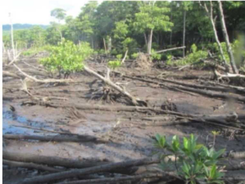
稚樹の発生が見られる上流域