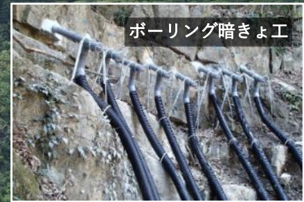
ボーリング暗きょ工