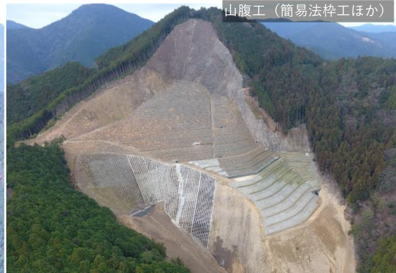
山腹工（簡易法砕工ほか）