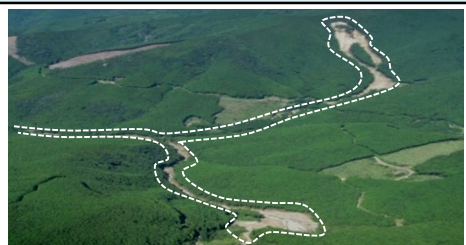
②本田垣内区域（田辺市西大谷） ・崩壊規模 3.70ha ・対策工：溪間工 山腹工