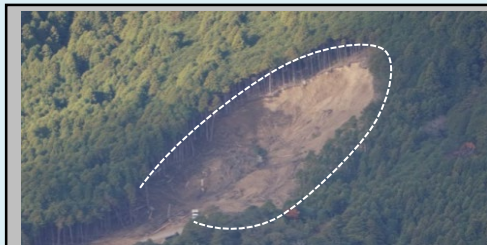
⑤菖蒲谷区域（田辺市本宮町三越） ・崩壊規模 0.90ha ・対策工：溪間工 山腹工 ※事業完了 移管済み