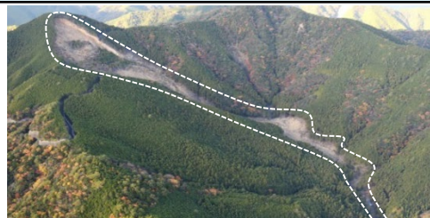
③上平治川区域（田辺市本宮町皆地） ・崩壊規模 6.26ha ・対策工：溪間工 山腹工