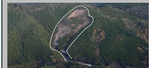
⑥八升前区域（田辺市本宮町湯峯） ・崩壊規模 1.55ha ・対策工：溪間工 山腹工 ※事業完了 移管済み