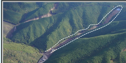
⑦愛賀合区域（田辺市鮎川） ・崩壊規模 0.77ha ・対策工：溪間工 山腹工 ※事業完了 移管済み