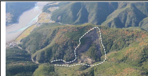
④下モ谷西側区域（田辺市本宮町上切原） ・崩壊規模 5.40ha ・対策工：溪間工 山腹工