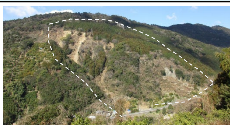
①上秋津区域（田辺市上秋津） ・崩壊規模 1.72ha ・対策工：山腹工 地下水排除工、溪間工