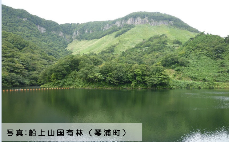
写真：船上山国有林（琴浦町）

令和5年度の天神川森林計画区の森林計画の策定に先立ち、地域の皆様のご意見を参考とするため、地域懇談会を開催します。