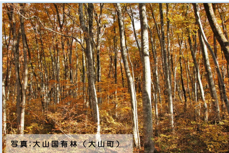
写真：大山国有林（大山町）

令和6年度の日野川森林計画区の森林計画の策定に先立ち、地域の皆様のご意見を参考とするため、地域懇談会と現地見学会を開催します。