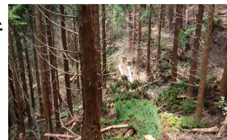
令和4年度本数調整伐施工地 (本谷奥国有林:琴浦町)