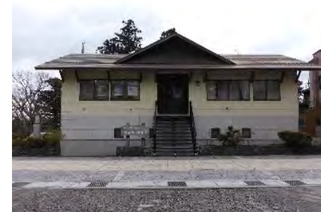
現在の大山治山事業所 (大山町)

このため、大正6年(1917年)に大阪営林局の直轄事業として事業に着手したことに始まり、昭和9年(1934年)の室戸台風を契機として事業区域を拡大し、昭和13年(1938年)に治山事業所(大山町大川寺)を設置して事業を行っています。