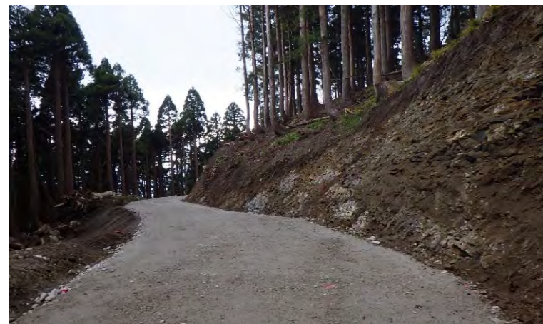
令和4年度林業専用道施工地 (小舟山国有林:若桜町)