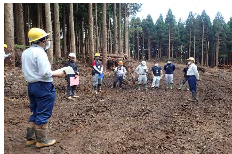
令和4年度小舟山森林共同施業団地での現地検討会(若桜町)