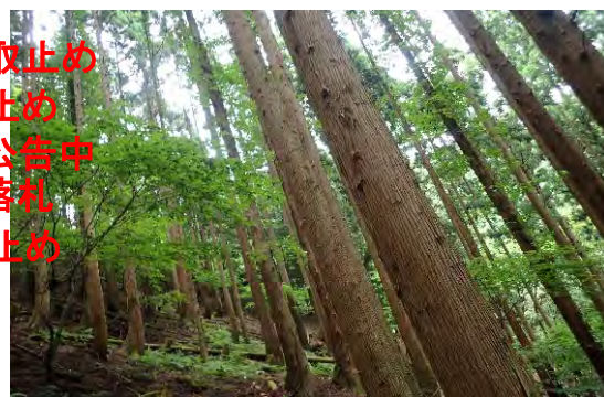
青木国有林(智頭町)