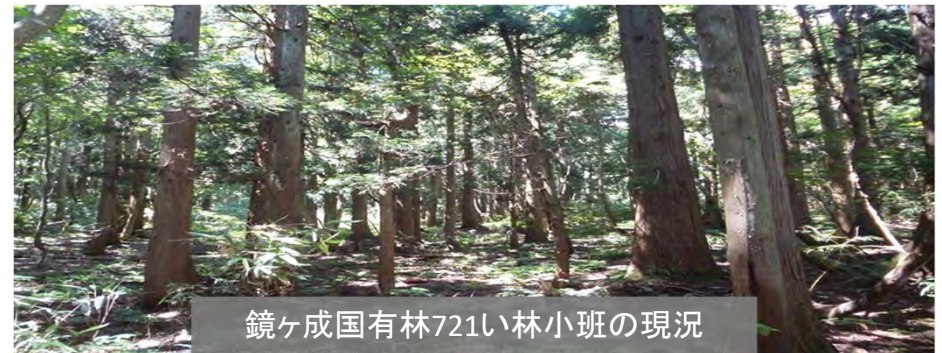
鏡ヶ成国有林721い林小班の現況