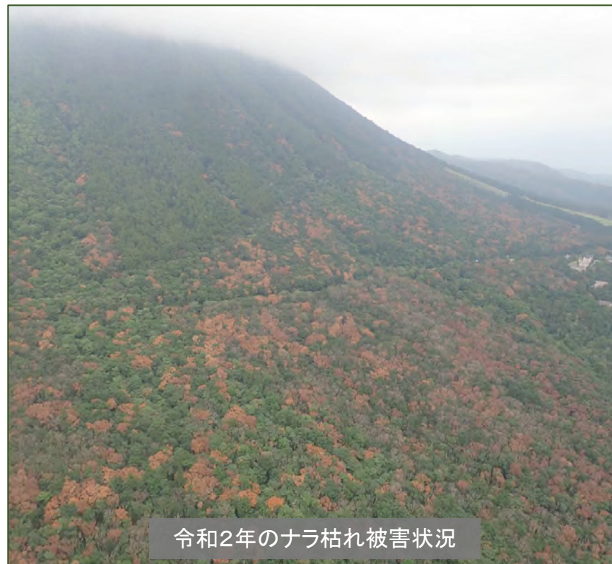
令和2年のナラ枯れ被害状況