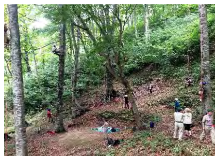
ツリークライミング (扇ノ仙国有林:八頭町)

扇ノ仙森林スポーツ林(扇ノ仙国有林:八頭町)は、林野庁が選ぶ「日本美しい森 お薦め国有林」全国93ヶ所の一つとして平成29年(2017年)に選定されました。ブナ林の中で登山、トレッキング、キャンプ及びバードウォッチングを楽しむことができます。