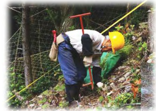
コンテナ苗植付の様子