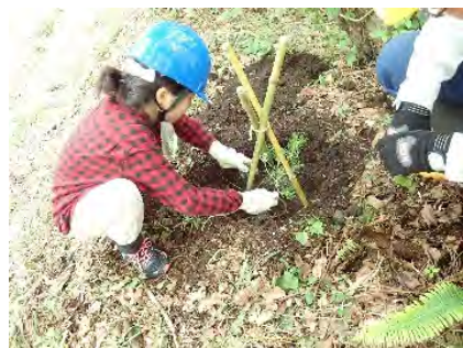
令和元年度植樹体験 (大山国有林:大山町)

➤ 大山並木松の植樹体験(大山国有林:大山町) 小学生及び地元関係者が、2代目大山並木松の植樹を行いました。