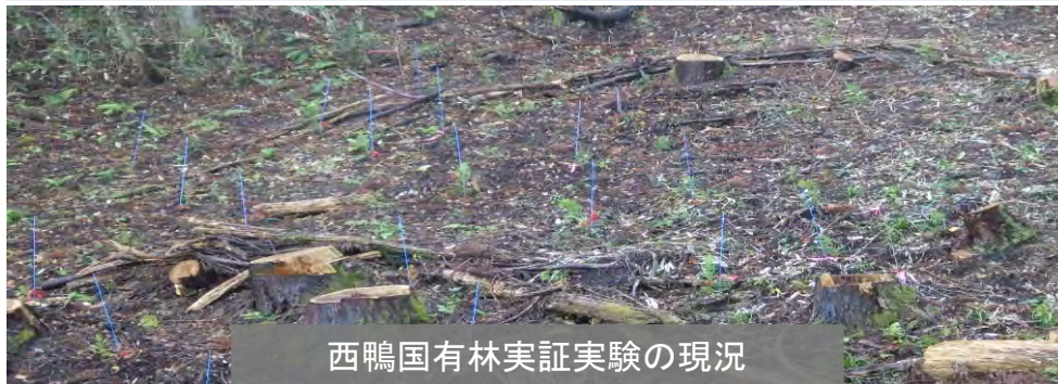
西鴨国有林実証実験の現況

雄花を全く着けないかごくわずかしか着けず、花粉飛散量の多い年でもほとんど花粉を出さない品種です。