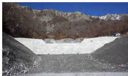
令和4年度床固工施工地 (大山国有林二ノ沢:大山町)