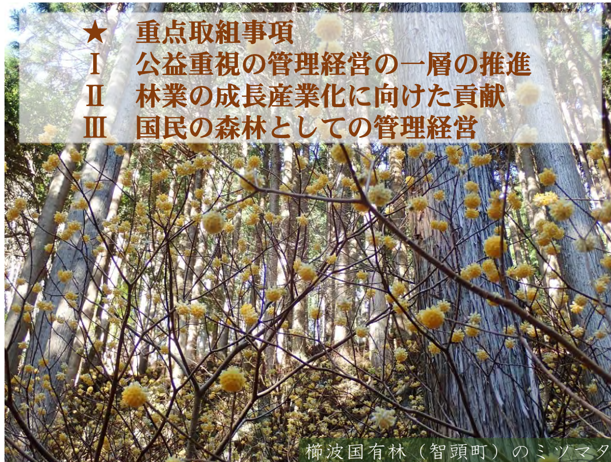
櫛波国有林（智頭町）のミソマタ