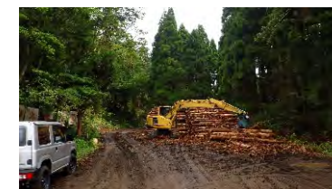
山土場での集積 (鍋割国有林:鳥取市)

合板用、バイオマス発電用の木材の計画的・安定的な供給を図るため、あらかじめ協定を締結した工場等へ直送します。