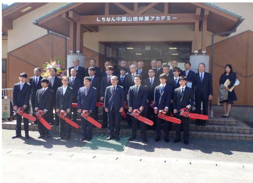
令和4年度アカデミー入学式 (日南町)

今年度は、14名(林業専修科12名、林業研修科2名)の学生が同アカデミーに入学しています。