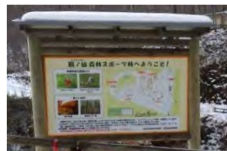
扇ノ仙森林スポーツ林看板 (扇ノ仙国有林:八頭町)