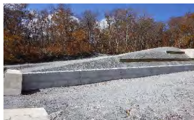
令和4年度護岸工施工地 (大山国有林三ノ沢:大山町)