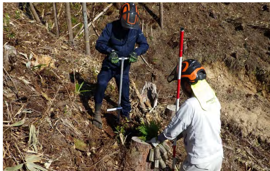
令和4年度アカデミー学生の 実習 の模様 (土屋山国有林:日南町)