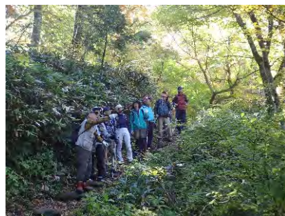
令和元年度自然観察会 (大山国有林:大山町)

➤ 大山森林生態系保護地域自然観察会の開催(大山国有林:大山町) 一般公募で応募いただいた方々を対象に、大山森林生態系保全管理協力員から説明を受けつつトレッキングを楽しみました。