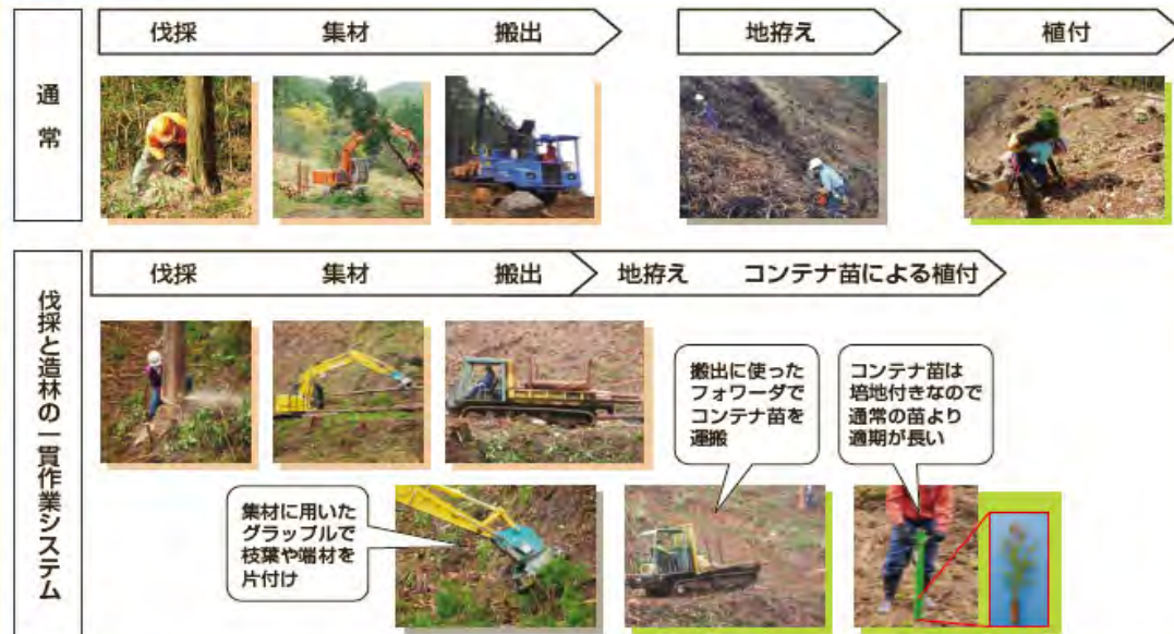
「伐採と造林の一貫作業システム」の仕組み