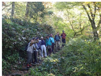
令和元年度自然観察会 (大山国有林:大山町)

➤ 大山森林生態系保護地域自然観察会の開催(大山国有林:大山町) 一般公募で応募いただいた方々を対象に、大山森林生態系保全管理協力員から説明を受けつつトレッキングを楽しみました。