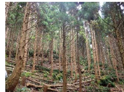
令和3年度本数調整伐施工地 (本谷奥国有林:琴浦町)