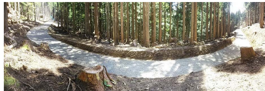
令和3年度林業専用道施工地 (小舟山国有林:若桜町)