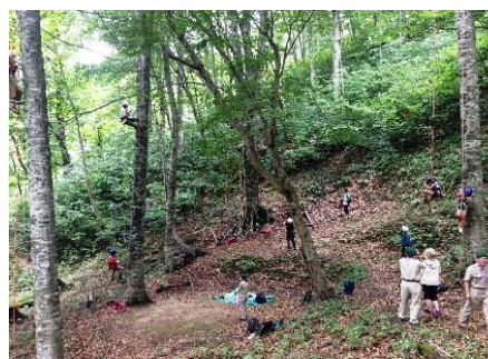
ツリークライミング (扇ノ仙国有林:八頭町)