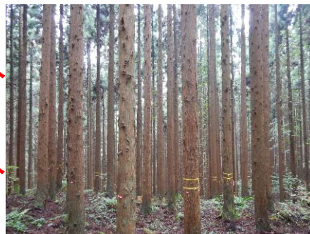
真山国有林(三朝町)