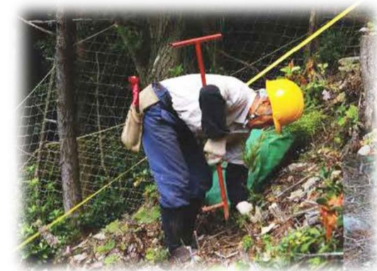
コンテナ苗植付の様子