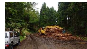
山土場での集積 (鍋割国有林:鳥取市)

合板用、バイオマス発電用の木材の計画的・安定的な供給を図るため、あらかじめ協定を締結した工場等へ直送します。