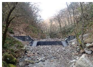
令和3年度谷止工施工地 (大流国有林:大山町)