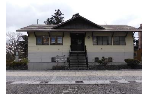
現在の大山治山事業所 (大山町)

このため、大正6年(1917年)に大阪営林局の直轄事業として事業に着手したことに始まり、昭和9年(1934年)の室戸台風を契機として事業区域を拡大し、昭和13年(1938年)に治山事業所(大山町大川寺)を設置して事業を行っています。