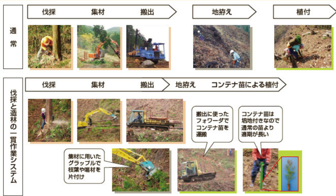
「伐採と造林の一貫作業システム」の仕組み