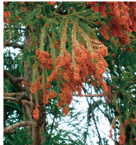
一般的な品種の枝

雄花を全く着けないかごくわずかしか着けず、花粉飛散量の多い年でもほとんど花粉を出さない品種です。