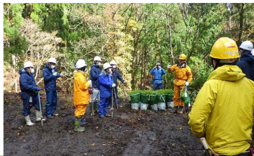
令和3年度県若手職員との意見交換の様子 (西鴨国有林:倉吉市)

林業技術等の民有林への普及を図るため、毎年テーマを決めて現地検討会を実施しています。本年度は、 西鴨国有林(倉吉市)において、複層林造成、シカ被害対策等をテーマに、県等民有林関係者の参加を募って実施しました。