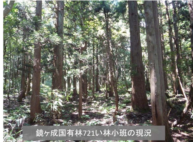
鏡ヶ成国有林721い林小班の現況

※当該地の伐採は、今後3カ年間の期間内で、買受者(契約者)の判断により実施できます。