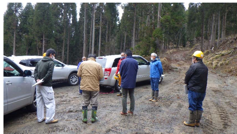
令和3年度小舟山地域森林共同施業団地での関係者協議(若桜町)