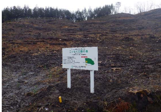
現地の全景(三朝町)