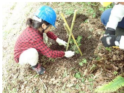
令和元年度植樹体験 (大山国有林:大山町)

➤ 大山並木松の植樹体験(大山国有林:大山町) 小学生及び地元関係者が、2代目大山並木松の植樹を行いました。