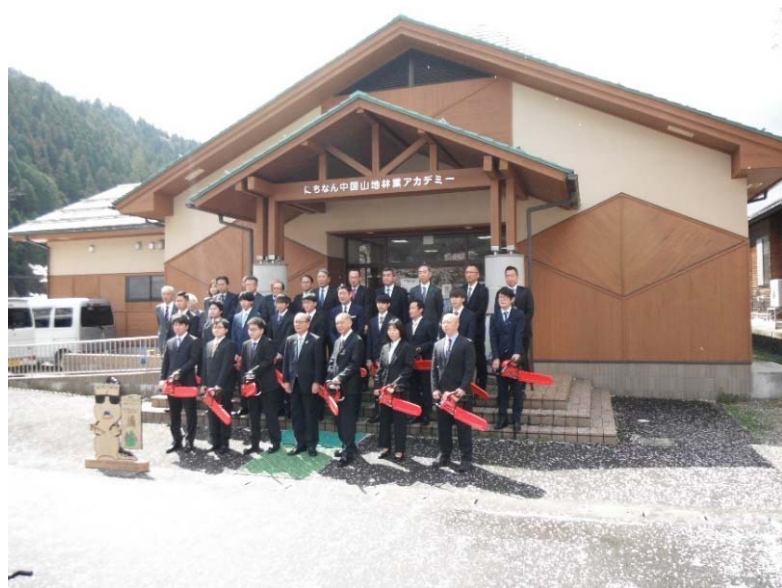
令和3年度アカデミー入学式 (日南町)

今年度は、林業専修科13名、林業研修科4名の学生が同アカデミーに入学しています。