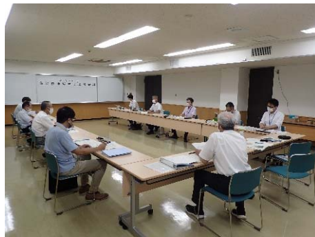
令和3年度連絡調整会議 (合同庁舎:鳥取市)

当年度事業の実施状況や次年度事業予定等の情報交換や意見交換の場として、 鳥取県関係部署及び水源林整備事務所と連絡調整会議を実施しました。 （昨年度は、新型コロナウイルス感染対策のため、未実施でした。）