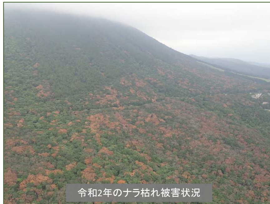
令和2年のナラ枯れ被害状況