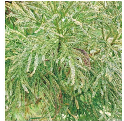
花粉の少ない品種の枝