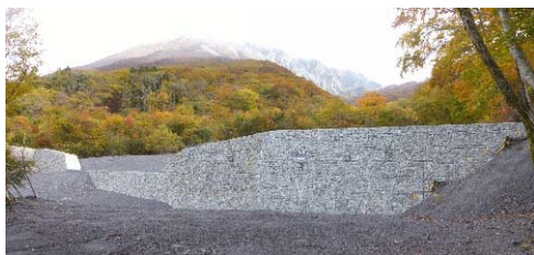
令和3年度床固工施工地 (大山国有林:大山町)