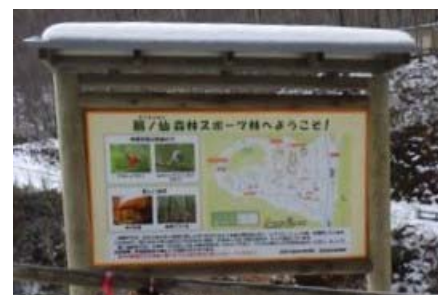
扇ノ仙森林スポーツ林看板 (扇ノ仙国有林:八頭町)