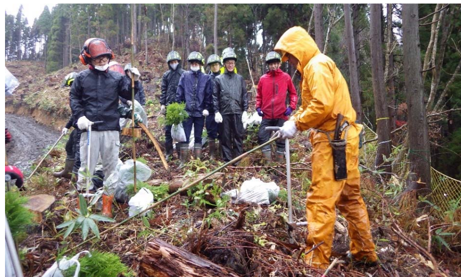
令和3年度アカデミー学生の視察の様相 (西鴨国有林:倉吉市)