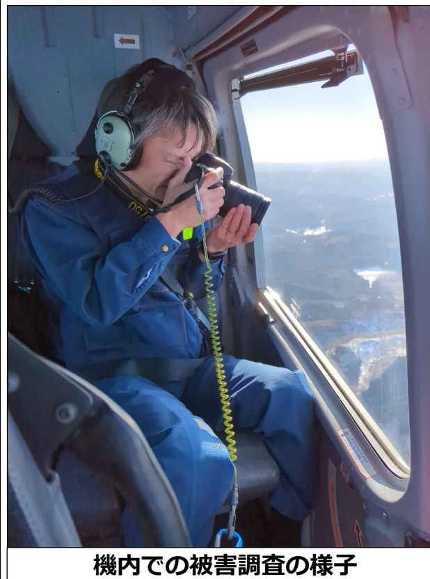
機内での被害調査の様子