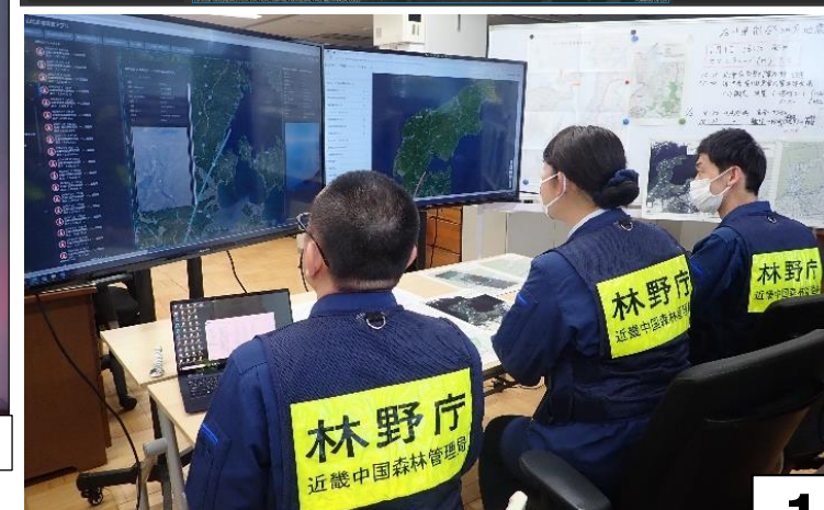
近畿中国森林管理局での被害状況確認の様子