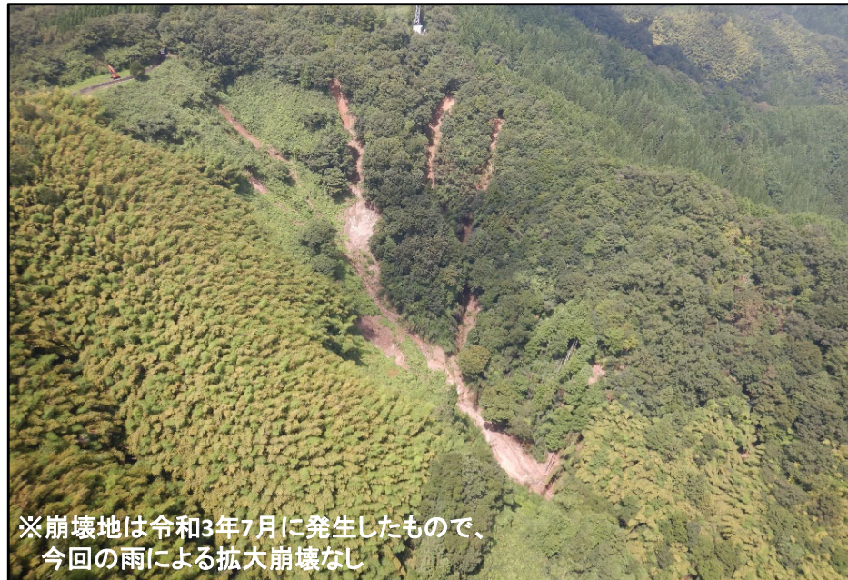
② 雲南市三刀屋町(民有林)