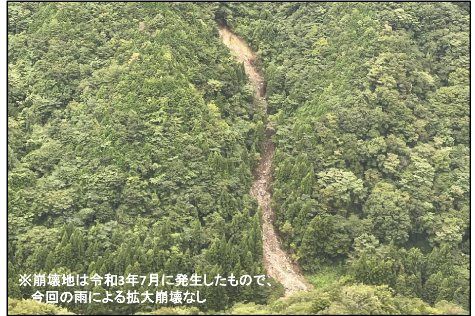
③ 雲南市掛合町(八重山国有林)