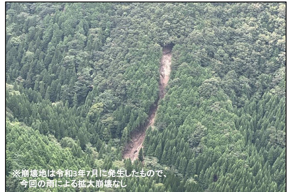
④ 雲南市吉田町(三谷国有林)