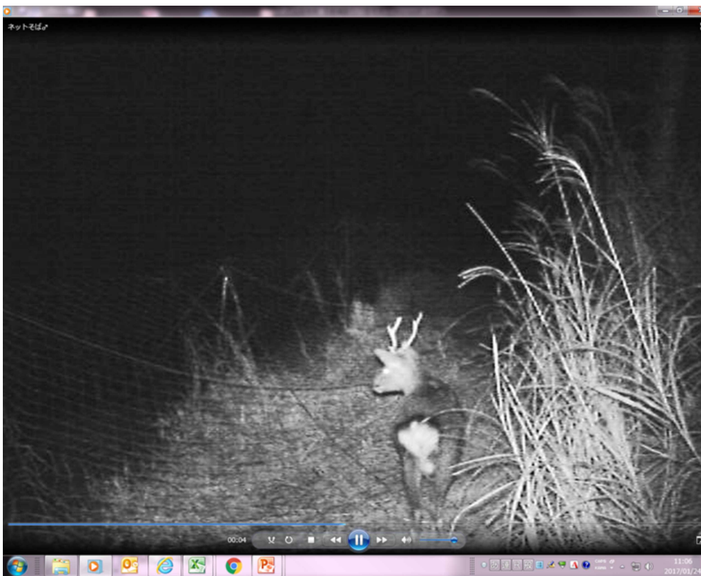
【ネット内を見つめるオスジカ】