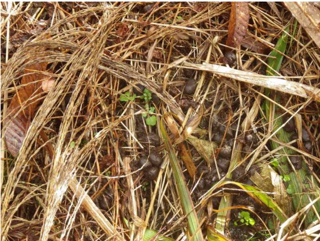
【ネットで発見したニホンジカの糞】