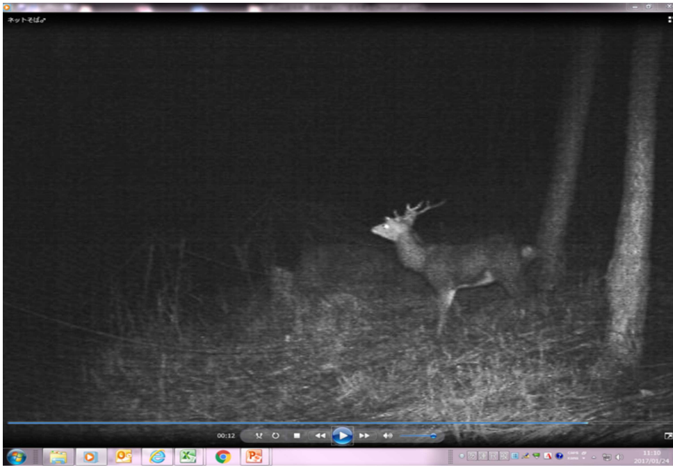
【ネット上部を見ているオスジカ】