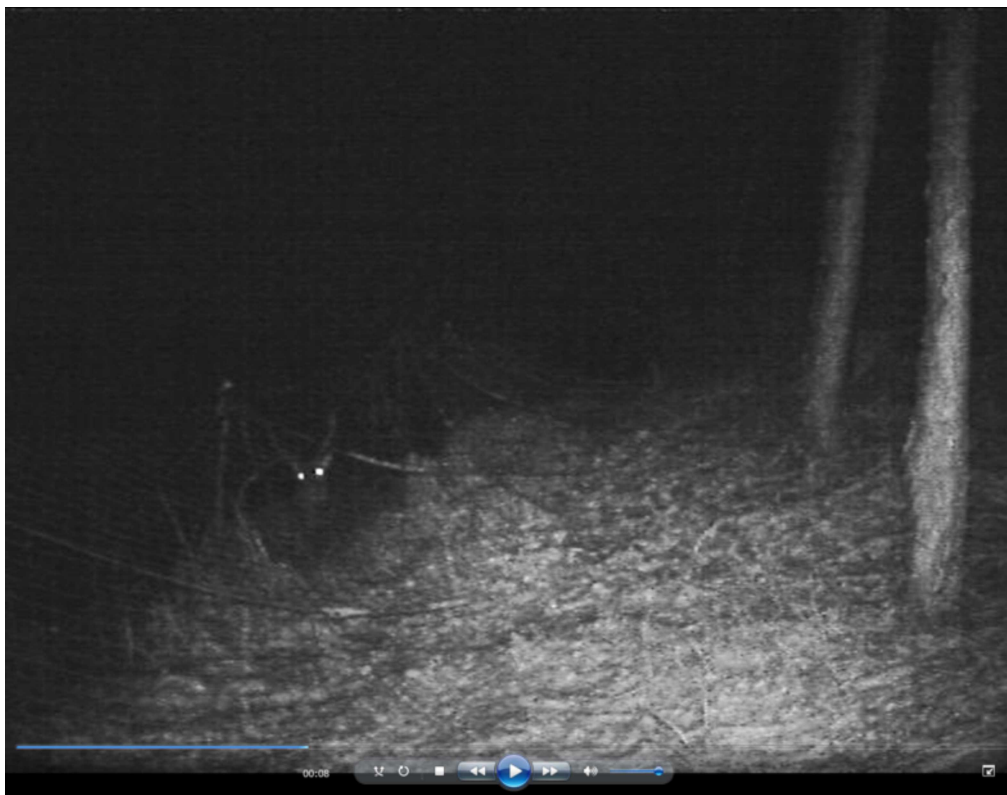
【ネット内に侵入しているオスジカ】