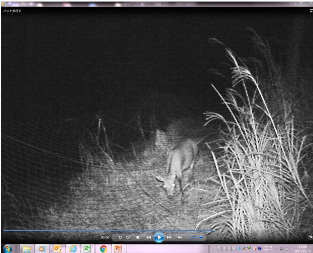
【ネット際を徘徊するメスジカ】