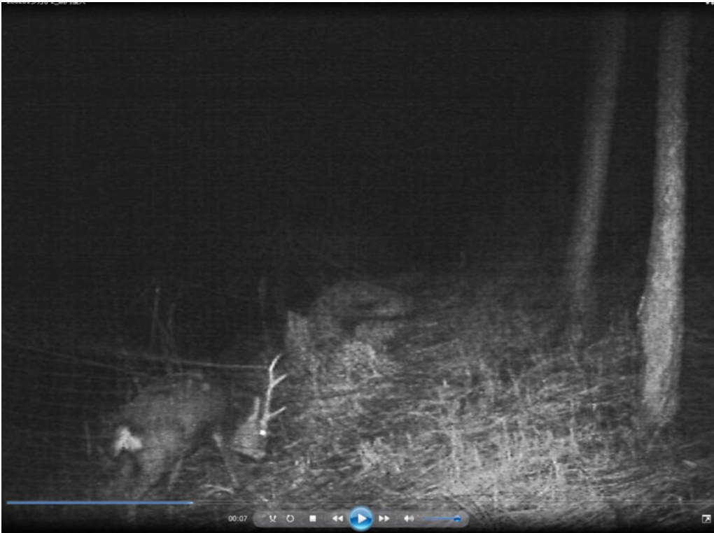
【侵入したネット内から出ようとしてもがいているオスジカ】