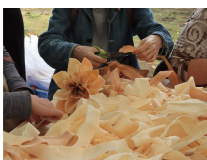
カンナくずで花づくり