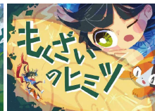
『もくざいのヒミツ』

近畿中国森林管理局の職員が、企画から描画までのすべてを行った「創作紙芝居」『雨水のぼうけん』、『もくざいのヒミツ』の2本立てで読み聞かせを行います。