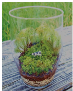
苔（こけ）テラリウムづくり