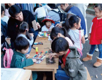
自然素材のクラフトコーナー