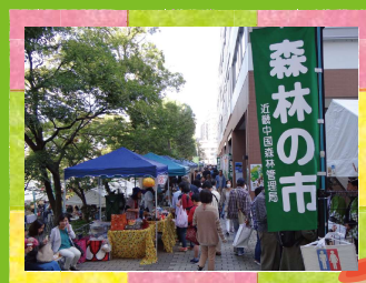
ご来場をお待ちしています♪