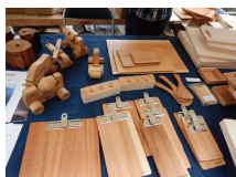
木製品の展示販売