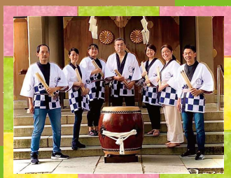
オープニング(9:40頃～)の祝太鼓演奏 八十島太鼓(生國魂神社 社中)