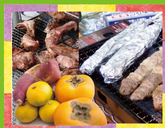
森林のごちそう フードコーナー