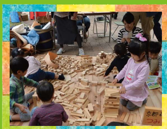
木とふれあう！ 木育コーナー