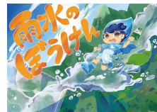
創作紙芝居『雨水のぼうけん』