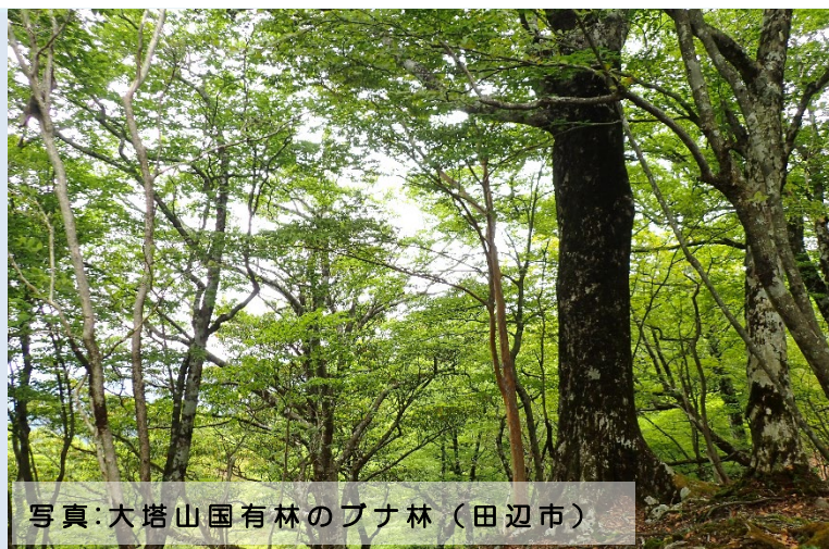
写真:大塔山国有林のブナ林(田辺市)

令和5年度の紀南森林計画区の森林計画の策定に先立ち、地域の皆様のご意見を参考とするため、地域懇談会と現地見学会を開催します。