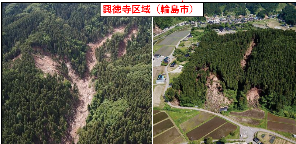
興徳寺区域（輪島市）