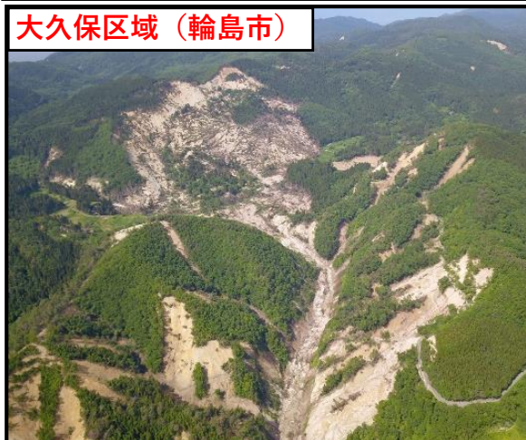
大久保区域（輪島市）