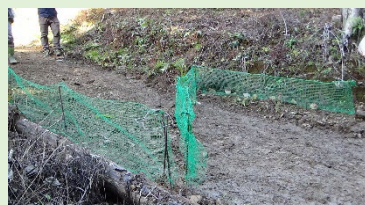
ノウサギのN型捕獲罠