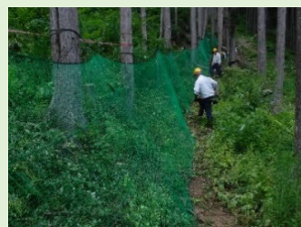
低コストシカ柵 (低価格ネットと立木利用)