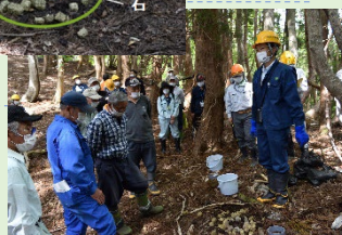
小林式誘引捕獲法