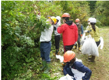
【昨年10月の種子採取状況】 (石川県立大、環境省、白山市と合同実施)

また、緑化のための土壌条件を改善させるため、肥料入りの土壌を定着させる航空緑化導入工Eを実施。