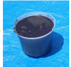
【種子、肥料を混ぜて泥状に】