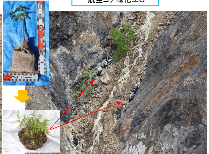
【ヤナギの挿し木設置状況】