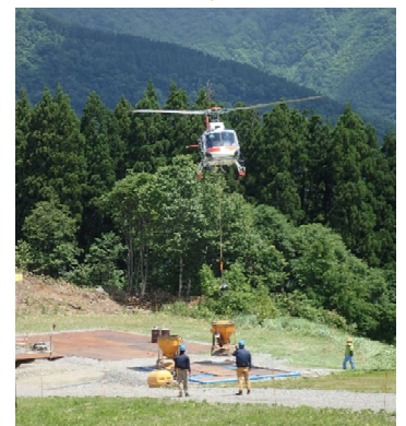
【ヘリコプターによる運搬】