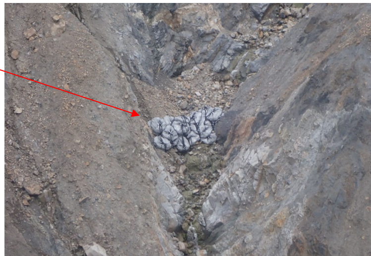
【ガリ一部への石詰袋設置後の状況】