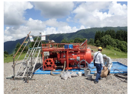
【種子、肥料配合プラント】