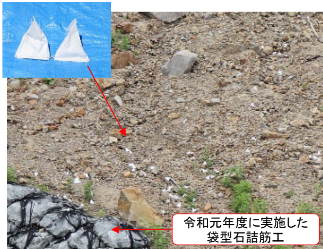
【水溶紙製容器散布後の状況】