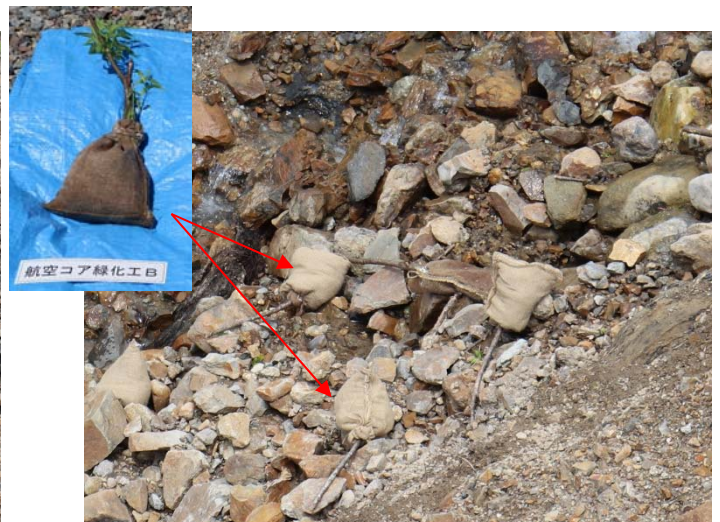
【湿潤部への麻袋散布後の状況】