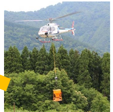
【ヘリコプターによる運搬】