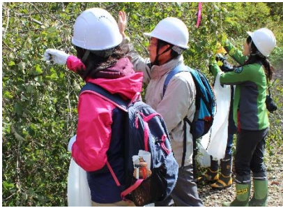
【昨年10月の種子採取状況】 （石川県立大、環境省、白山市と合同実施）