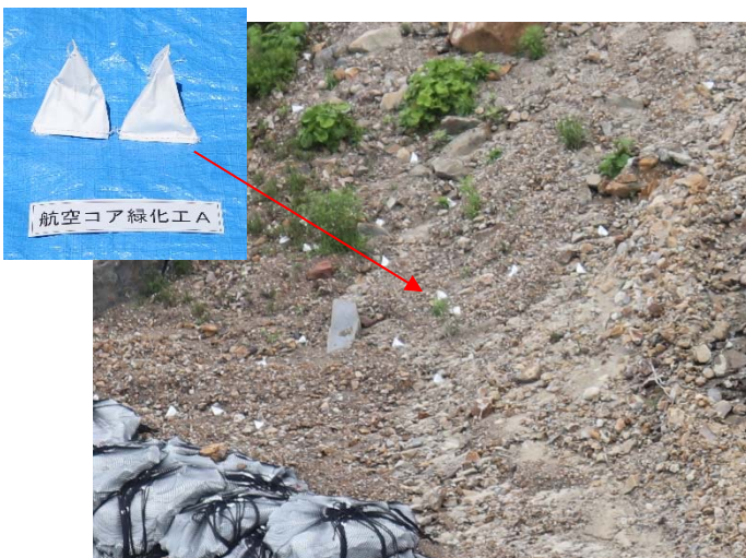
【水溶性容器散布後の状況】