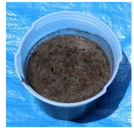
【種子、肥料等を混ぜて泥状に】