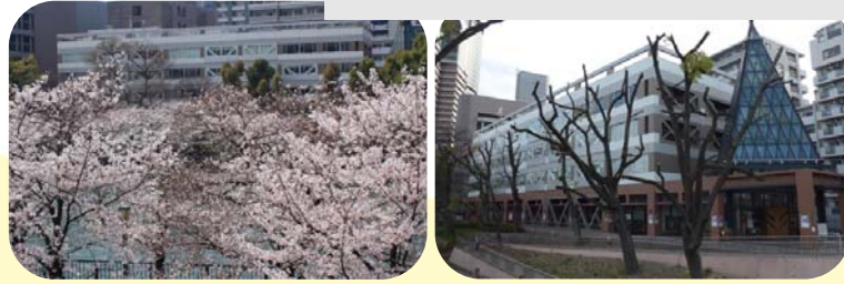
【近畿中国森林管理局の外観】