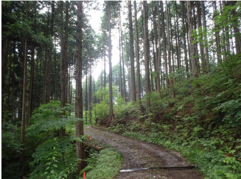
基礎額算定林分 林況写真