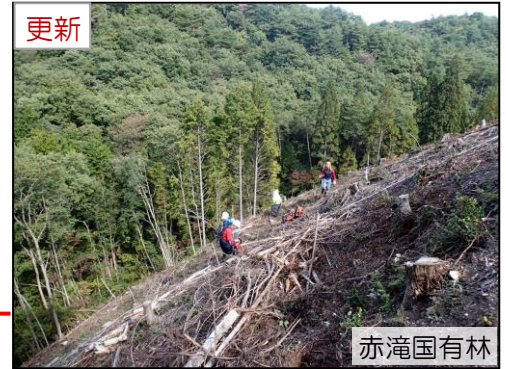
赤滝国有林 新植（コンテナ苗）