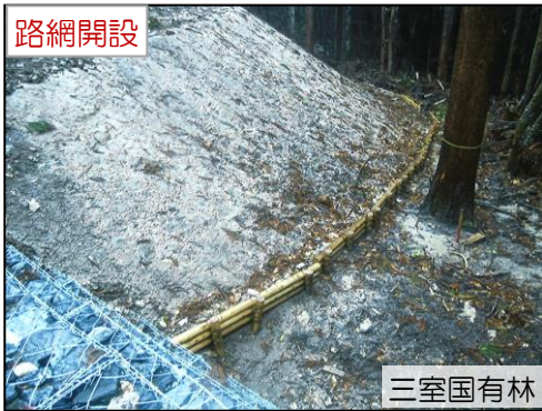
三室国有林 木材利用（木柵工/盛土法尻留） 三室林業専用道新設工事