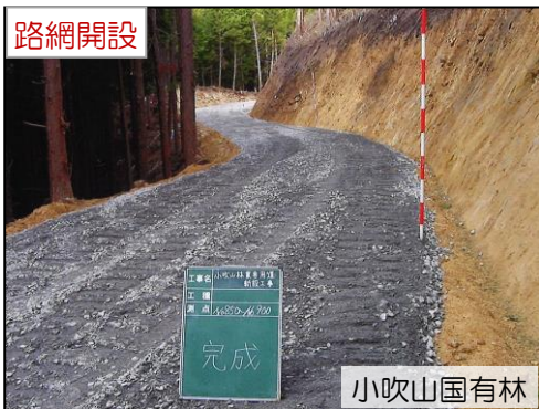
小吹山国有林 小吹山林業専用道新設工事