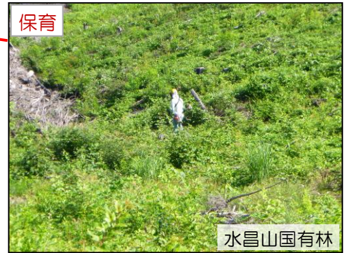
水昌山国有林 下刈