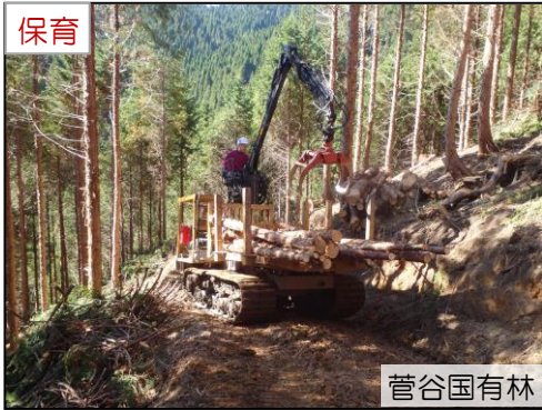
菅谷国有林 フォワーダによる積込・運搬