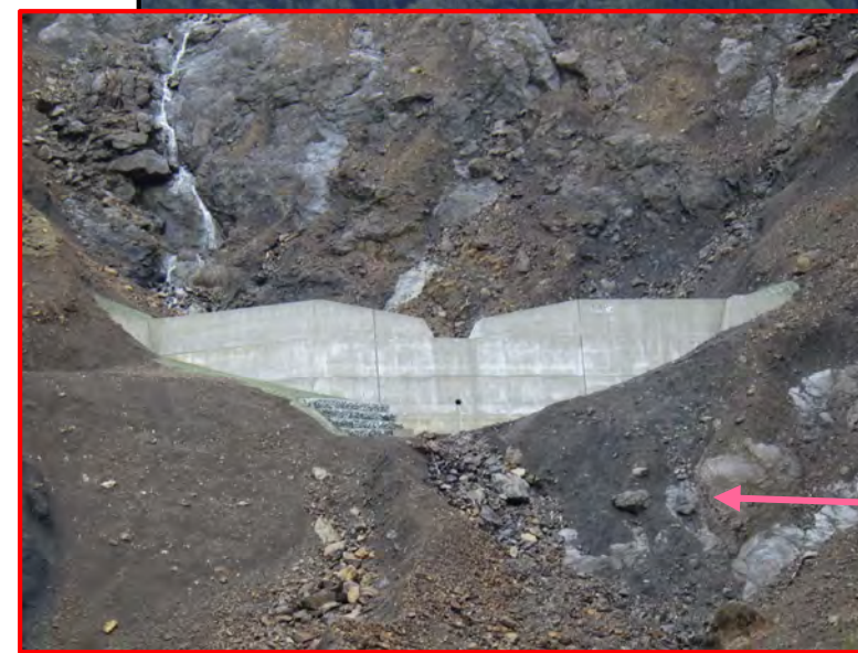
第1号谷止工 完成状況