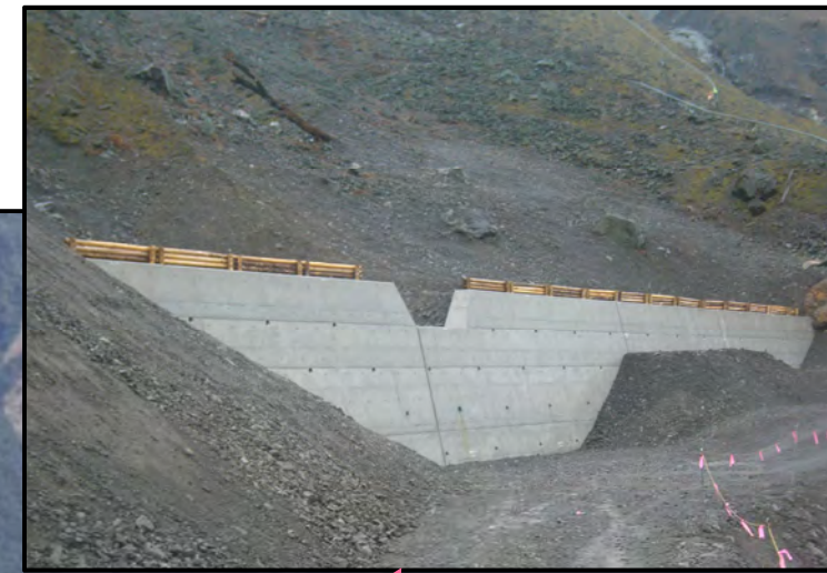
第2号土留工 完成状況