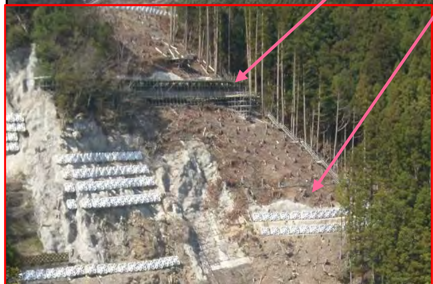
アンカー工 施工状況