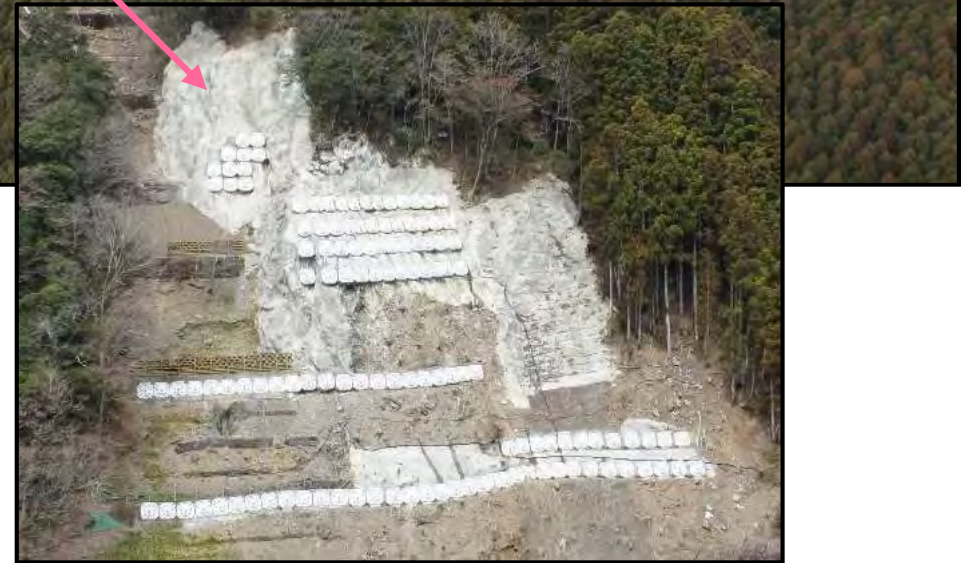
アンカー工 完成状況