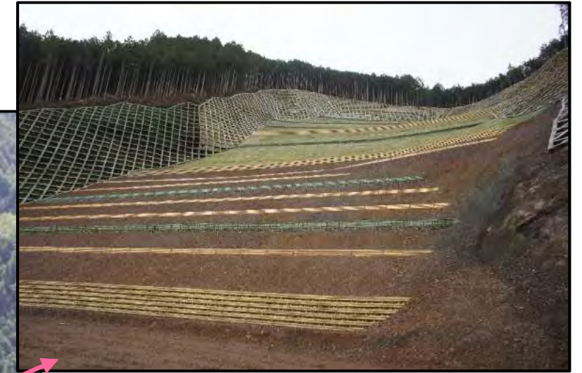
木製ブロック土留工・法砕工 完成状況