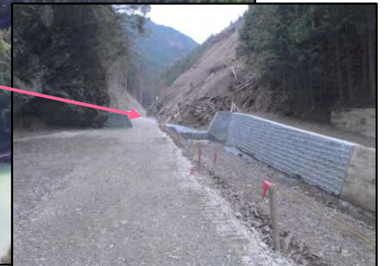
第1号床固工 完成状況