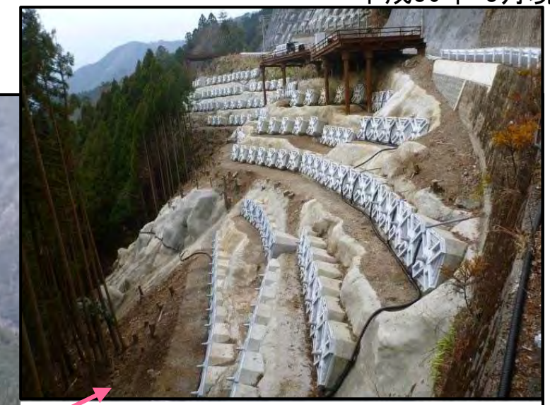
アンカー工 完成状況