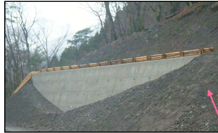
第1号土留工 完成状況