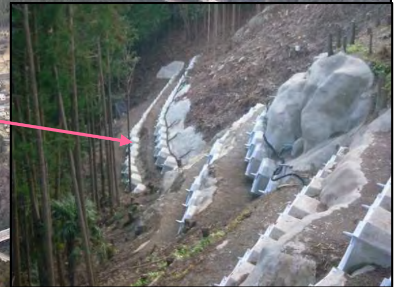
アンカー工 完成状況