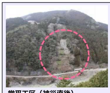
堂平工区(被災直後) ・地すべり兆候の規 3.00ha ・対策: アンカー工 (令和3年度工事完了・移管済)