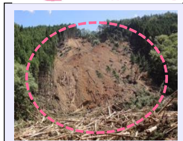
檜股工区(被災直後) ・崩壊規模 1.56ha ・対策: 谷止工及び山腹工 (令和3年度工事完了・移管済)