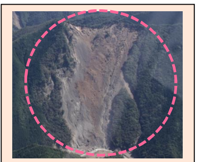
赤谷工区(被災直後) ・崩壊規模 24.86ha ・対策: 山腹工及び土留工