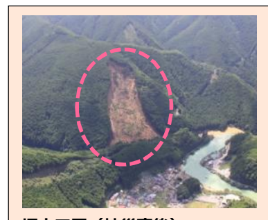
坪内工区(被災直後) ・崩壊規模 3.65ha ・対策: 床固工及び山腹工