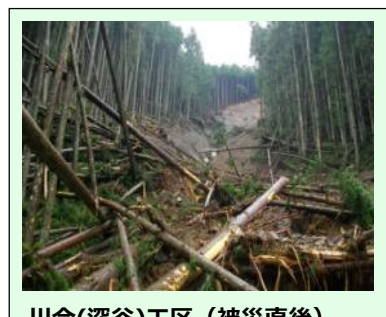
川合(深谷)工区(被災直後) ・崩壊規模 0.54ha ・対策: 山腹工 (平成25年度工事完了)