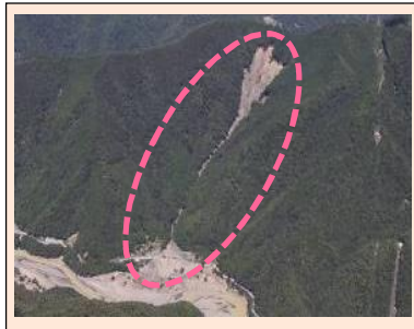
長殿(テラ谷)工区(被災直後) ・崩壊規模 2.75ha ・対策：谷止工、山腹工