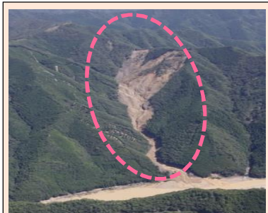
野尻工区(被災直後) ・崩壊規模 20.44ha ・対策：谷止工、山腹工