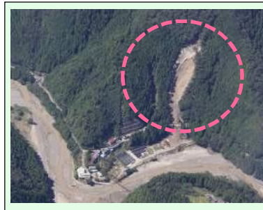
五百瀬工区(1号地)(被災直後) ・崩壊規模 0.47ha ・対策：山腹工 (令和4年度工事完了)