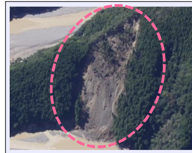
折立工区(被災直後) ・崩壊規模 2.36ha ・対策：山腹工 (平成27年度工事完了・移管済)