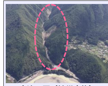
高津工区(被災直後) ・崩壊規模 2.67ha ・対策：谷止工、山腹工 (平成30年度工事完了・移管済)