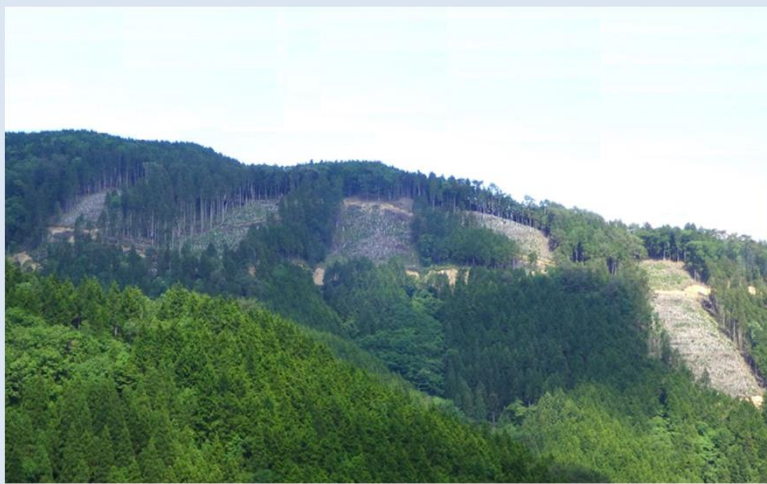
写真: 带状で設定した複層林 桧股国有林(野迫川村)

令和7年度の北山・十津川森林計画区の森林計画の策定に先立ち、地域の皆様のご意見を参考とするため、地域懇談会を開催します。