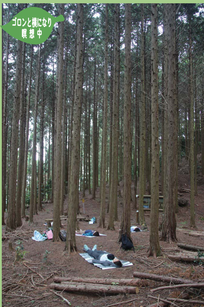
ゴロンと横になり 瞑想中

植物に目をとめたり、虫眼鏡を使って拡大して見たり、いろんな葉っぱに触って感触の違いを感じたり、樹々の中で寝っ転がって瞑想したり、五感で感じることの体験に「すっかり心身がリラックスした」「とても安心して過ごせて感謝です」「また来たい」など、参加者の皆さんから、森での癒やし・セラピー効果を感じたとの感想を多くいただきました。