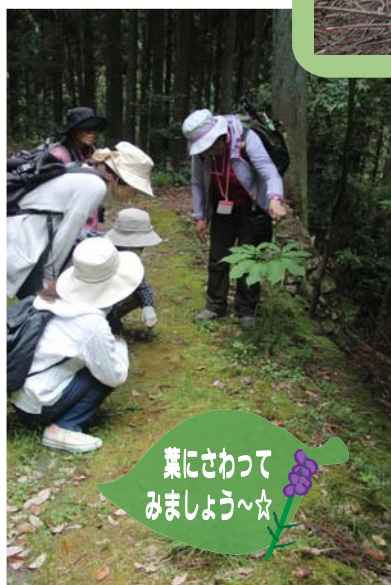
葉にさわって みましよう〜☆