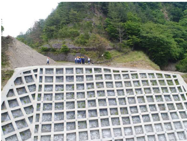
入道ヶ岳国有林の山腹工事現場

また、現地の谷でポール横断測量などを行い、署に戻ってから測量したデータで谷止めの図面を作成しました。