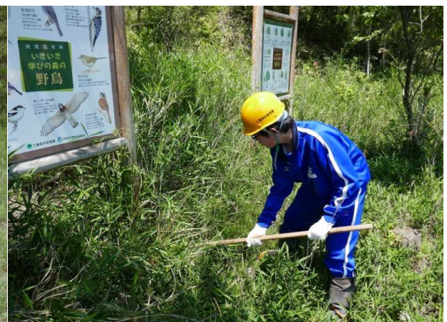
看板周囲の草刈作業