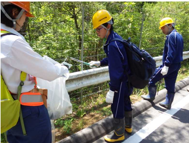
青岳国有林沿いでのゴミ回収

6日(木曜日)は、青岳国有林(伊賀市)で、国有林沿いの道路に投棄された瓶・缶などゴミの回収を行いました。昨年ゴミ拾いをした場所で、また大きな袋いっぱいのゴミが出て、「ゴミを捨てるな」の気持ちが強くなっていました。その後、焼尾国有林(伊賀市)に移動し、森林整備の保護事業として行っているマツ枯れ等の伐倒駆除事業箇所、ビニールで梱包した処理木のことなど事業内容の説明を行いました。午後からは、毎年森林環境教育のイベントで使っている焼尾国有林の遊々の森で、案内看板の周囲の草刈りをしました。初めて見る下刈鎌を使い、上手に刈っていました。