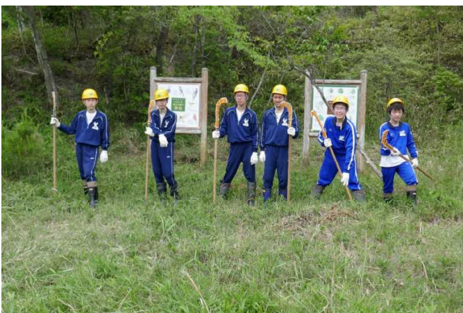
草刈を終えて記念撮影