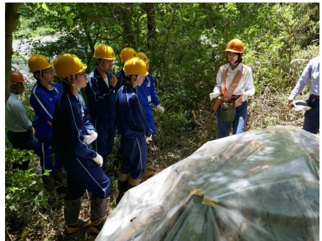
マツ枯れ伐倒駆除作業での説明