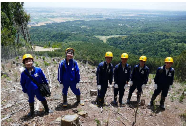
福王山国有林の植付箇所

昼前に署を出発し、福王山国有林(菰野町)に向かい、去年の春に植栽した箇所での成長状況の確認やシカ防護柵の点検を行いました。傾斜のある山を登り、新植箇所の周囲に張られたシカ柵が破れていないかなどを点検してもらいましたが、上の方ではシカが侵入して芽が食べられている箇所もありました。