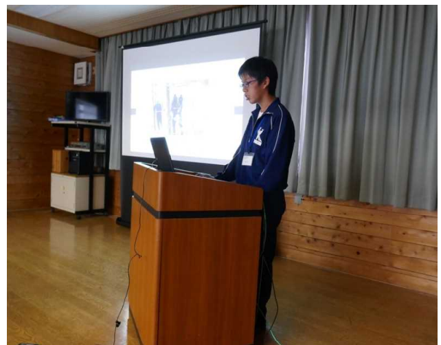
体験をみんなの前で発表