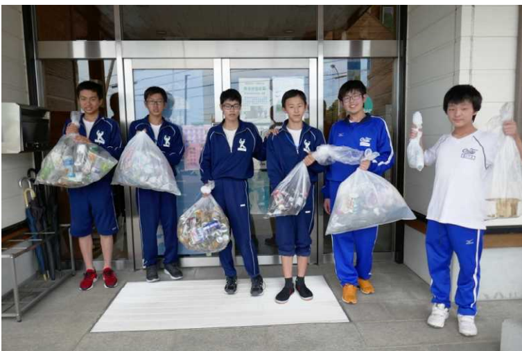
三重署玄関前で 回収したゴミと記念撮影