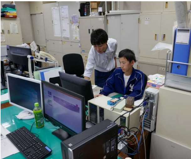
パソコンでまとめ作業

また、5日間の中でゴミ捨て禁止の注意ポスターも作成してもらい、三重森林管理署の玄関に掲示しました。