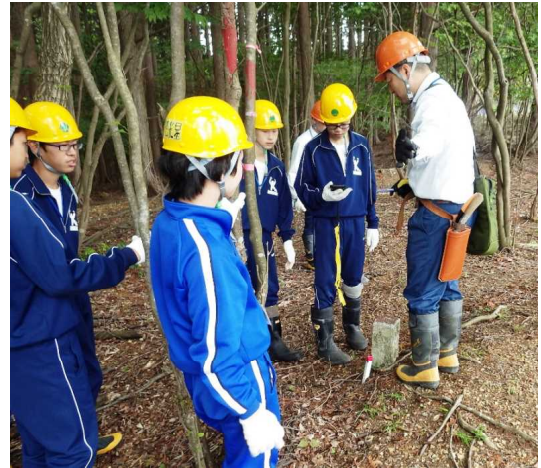
境界標識を確認する