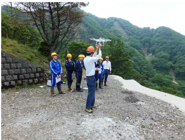
ドローン操作体験