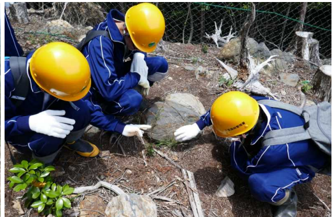
苗木のシカ被害を見る