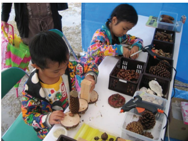
丸太と木の實を組み合わせます