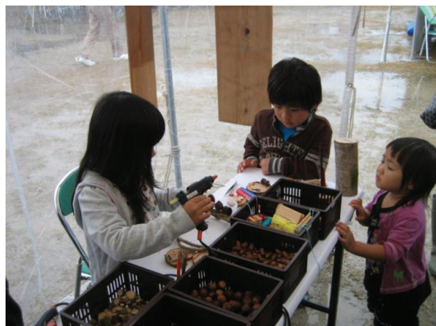
グルーガンを上手に使えるようになりました