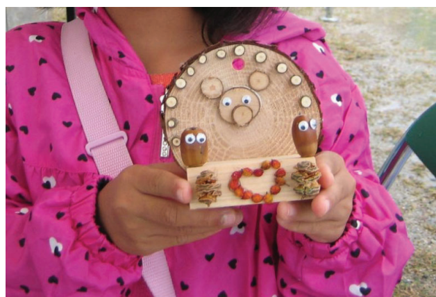
かわいい作品ができました