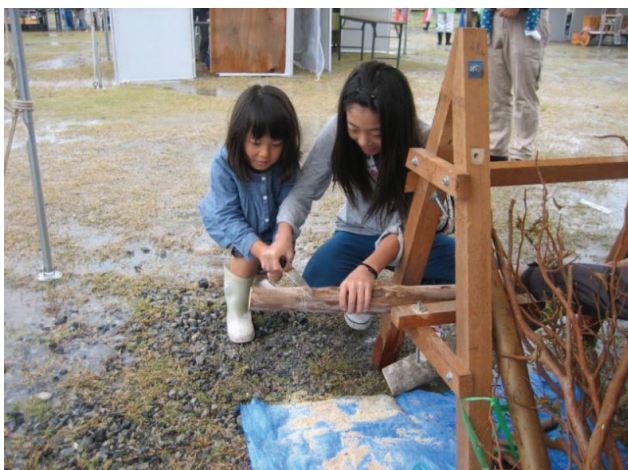
一生懸命のこぎりを挽きます

多くの方々が、森林や木、自然の素材に触れることで、森林・林業に対する理解を深めることができました。