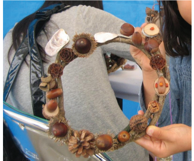
クリスマスリースを作りました