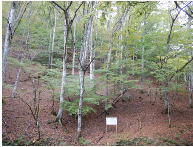
【阿舎利国有林（ケヤキ人工林）】

管内には、天然水を求める人々が訪れる「一宮町名水七選」があることもあり、その水源に位置する国有林については、ほぼ全域の機能類型が水源涵養タイプで人工林率が75%と高くなっています。