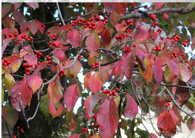
【秋に紅葉し、赤い実をつけたハナミズキ】