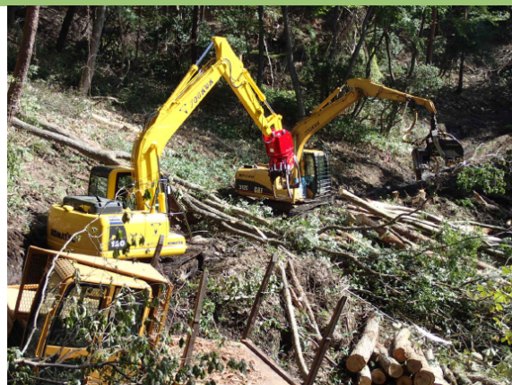
【搬出作業の様子（令和元年度）】

障となるなど、作業効率が悪くなったためと分析し、令和元年度は、帯状の皆伐と、伐採材積率6割の抜き伐りを行いました。