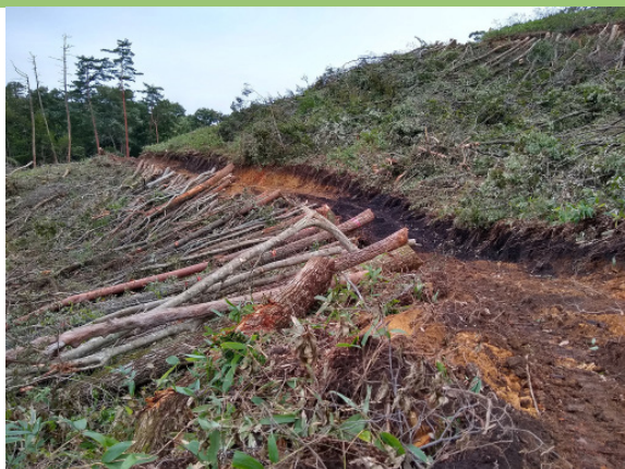
【帯状皆伐区域の様子（令和元年度）】