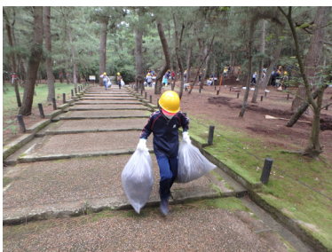
【集めた松葉を運びます】

石川森林管理署長の開会挨拶の後、当署職員による海岸林の役割説明や松葉かき作業の実演を行いました。その後、小学生と地域住民が14班に分かれて、それぞれの場所で約1時間松葉かきを行いました。作業ははかどり、合計約1,800kgの松葉を取り除くことができました。松葉かきを行った小学生からは、「最初は難しそうだと思ったけど、きれいにすることができ気持ちよかった」「また、松葉かき作業をやってみたい」などの感想をいただきました。今後とも、安宅小学校の「遊々の森」を活用した体験活動や保全活動などへ積極的に協力していくとともに、地域の皆様と海岸林を保全する活動や普及啓発なども取り組んでまいりたいと思います。