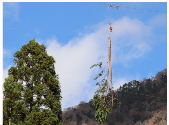
【空中に吊られる木材】