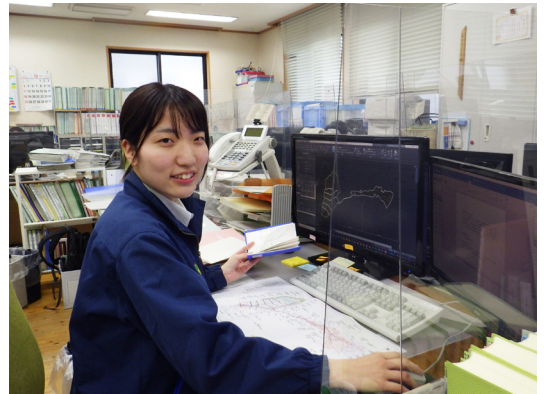
【事務所内で執務中】

色んな地方の出身者の方がいるので、様々な話を聞くことができます。また、出張で普段なら行けないような奥地へと足を踏み入れることができるのが魅力の一つだと思います。