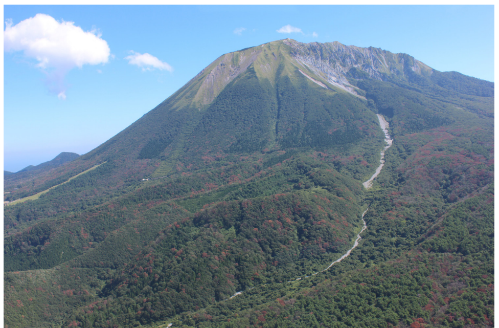
ナラ枯れ被害の様子 ぼうき だいせん 【鳥取県伯耆町 大山国有林】

一方、近年、コナラ、シイ、カシなどの広葉樹が集団で枯れる「ナラ枯れ」の被害が全国的に確認されてきています。このナラ枯れは、体長5mm程度の甲虫である「カシノナガキクイムシ」がナラやカシ類等の幹に侵入することで樹体内に持ち込まれた「ナラ菌」により、ナラやカシ類の樹木が集団的に枯死する現象です。また、カシノナガキクイムシは、高齢の大径木を好むことから、大径木化したコナラ等の里山広葉樹を伐採し、若い森林に戻すことが、ナラ枯れ被害対策の観点からも重要である