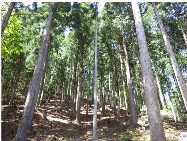
【阿舎利国有林（スギ人工林）】

地形は全般的に急峻で、隣接する宍粟市波賀町や養父市等との境界付近には標高900～1,100m級の山々が連なっています。管内の国有林は、スギ、ヒノキを主体とした針葉樹林と、クリ、ナラ類、ケヤキ、トチノキ等の広葉樹林から構成されています。