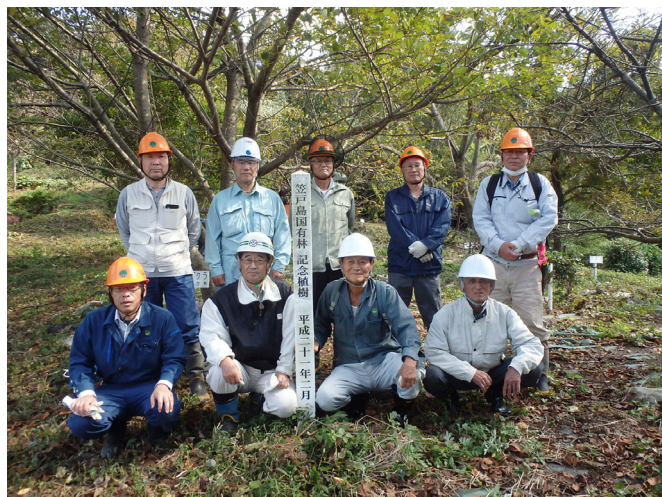
【参加者の集合写真】

繁茂したクズを処理することにより、綺麗になった林内を見て森林整備の大切さを再確認できた1日でした。