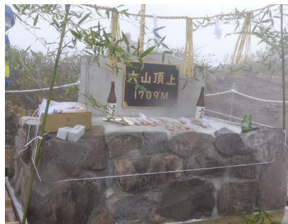
【今回完成した大山山頂碑】

大山隠岐国立公園の大山山頂(大山国有林)で、10月14日頂上碑の移設工事の完成を記念して式典が開催されました。