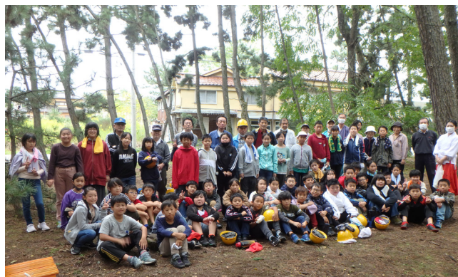
【活動後の集合写真】

石川森林管理署長の開会挨拶の後、当署職員による海岸林の役割説明や松葉かき作業の実演を行いました。その後、小学生と地域住民が14班に分かれて、それぞれの場所で約1時間松葉かきを行いました。作業ははかどり、合計約1,800kgの松葉を取り除くことができました。松葉かきを行った小学生からは、「最初は難しそうだと思ったけど、きれいにすることができ気持ちよかった」「また、松葉かき作業をやってみたい」などの感想をいただきました。今後とも、安宅小学校の「遊々の森」を活用した体験活動や保全活動などへ積極的に協力していくとともに、地域の皆様と海岸林を保全する活動や普及啓発なども取り組んでまいりたいと思います。