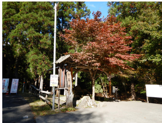
【一宮町名水七選・千年水】