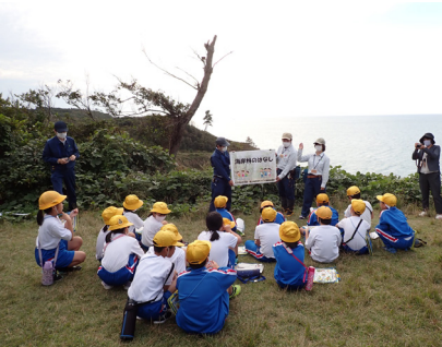
【職員による海岸林の説明】

があるという説明をしました。その後、岬まで歩き、林内と林外の風の強さの違いを実体験しました。