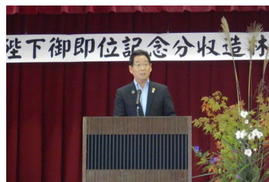
【福元宍粟市長の挨拶】