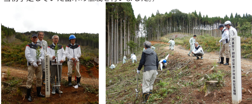
【河原山国有林の分収造林地で苗木の植栽】

(記念植樹は残念ながら天候の関係で中止となりましたが、有志の参加を募り、河原山 かわらやま 国有林にある分収造林地で当初予定していた苗木の植栽を行いました。)