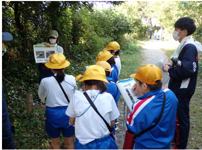
【職員による樹木の説明】

かれて海岸林内の遊歩道を歩きながら、石川森林管理署職員がクリやクロマツなど自生する樹木14種類について、クイズを交えつつ説明し