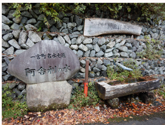
【一宮町名水七選・阿舎利の水】

阿舎利国有林には、大正2年に植栽されたケヤキ人工林があります。令和2年度現在108年生で、歴史的木造建造物の修復用材を確保するため、文化財継承林に設定して、将来の修復用材（ケヤキの大径長尺材）となる森林として育成しています。