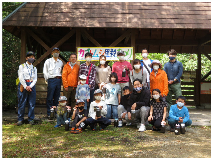
【参加者の集合写真】

参加者が自宅に持ち帰ったカブトムシが無事に成長して、来年の初夏には成虫になることを願っています。