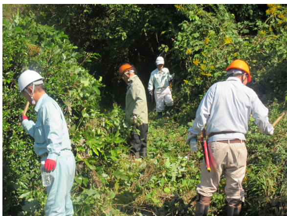
【カマを使つてのクズ処理】

OF会は、森林管理署等の退職者で構成された団体で、国有林をフィールドとしたボランティア活動を通じて国民参加の森づくり活動に貢献しています。