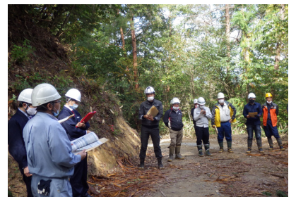
【地方産業安全専門官からの説明】

点検を終えた三次労働基準監督署から、それぞれの高性能林業機械の間隔が十分に保たれ、かつ連絡（合図）も良好に行われている。また、伐倒作業時において、伐倒木の樹高の2倍以上の間隔も保たれているとの報告がありました。その後、伐倒時及びかかり木処理についての指導がありました。