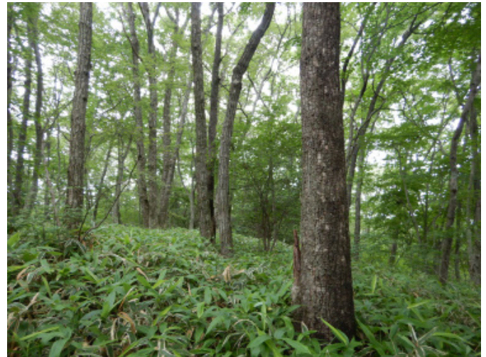
伐採前の里山広葉樹の林相 かまたに 【岡山県新見市 釜谷国有林】

これは、資源利用の観点からみると、薪やバイオマス発電用のチップといった燃料、しいたけ原木としての利用だけではなく、製材として利用できるサイズに育ってきているといえます。