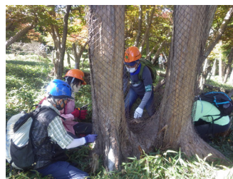
【ネット巻きの様子】

稚樹を守る防護柵内のササ刈りを行う班と樹木の剥離被害から守るネット巻きを行う班に分かれ、それぞれ1時間程度の作業を実施していただきました。