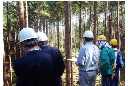
【合同パトロールの様子】

この日の合同パトロールには、当署の事業を実行中の8事業体の現場責任者、犬伏山国有林の森林整備事業を実行中の事業体から総勢17名が参加しました。現場環境が異なる中、それぞれの事業種に見合った点検箇所、点検ポイントなどについて学びました。