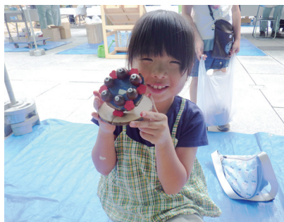
木工クラフト体験

当署は、例年の参加で好評を得ているどんぐりや松ぼっくり等の材料を使った木工クラフト体験及び森林・林業や治山事業について紹介したパネル展示を行いました。