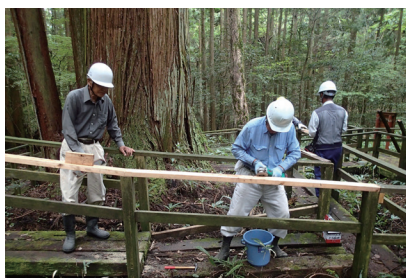
スロープ修繕の様子

作業内容は三本 杉※ 2 の周囲に設 置している木造ス ロープの修繕・補 修作業及び滑マツ なめら までの林道の刈払