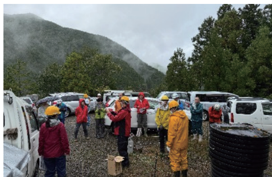
大型排水管を活用した残渣処理について説明

当日の天候は、朝から雨天となったため、海山リサイク ルセンター（三重県紀北町）の会議室をお借りして、概要 説明を行った後、現地の大杉谷国有林へ移動しました。