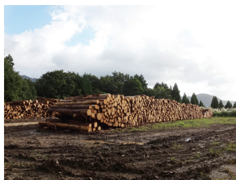
システム販売 (山の土場に集積している様子)