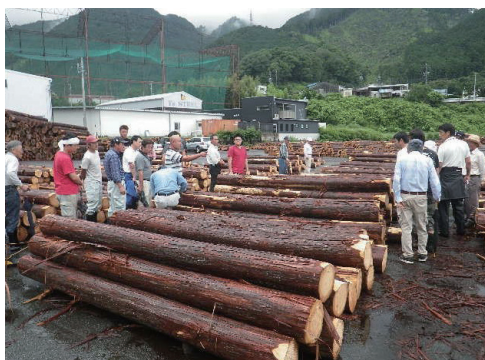
委託販売（せり売りの様子）