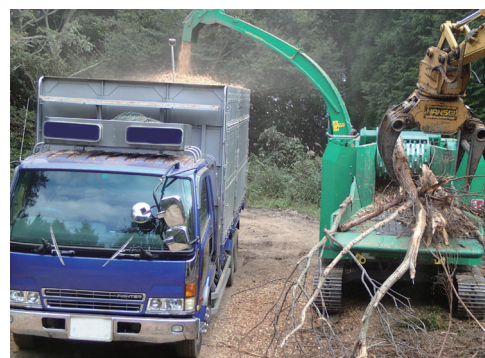
木材チップに加工している様子

このように生産された丸太は、材質や用途等に応じて加工され、皆様の生活の中で利用されています。