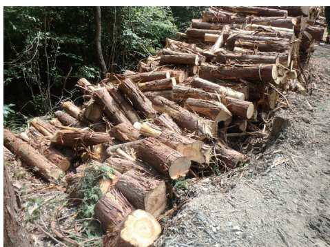
端材等の集積の様子