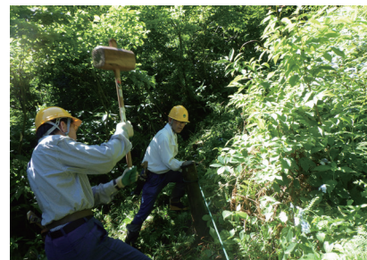
大杉を保全するためのロープ柵補修

当日は梅雨の晴れ間でとても暑かったですが、「桃木峠の大杉」を見に来られる方が歩道を安全に利用できるよう、額に汗を浮かべながら刈払いや歩道周辺のロープ柵の補修を行いました。