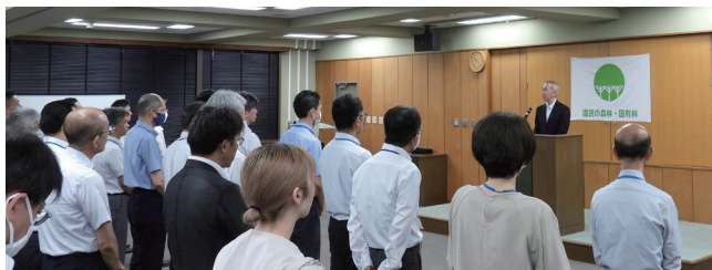
局長から職員への訓示の様子

私も全力を尽くすつもりですので、今後とも地域の皆さまのご理解とご協力を頂けるよう努めてまいります。