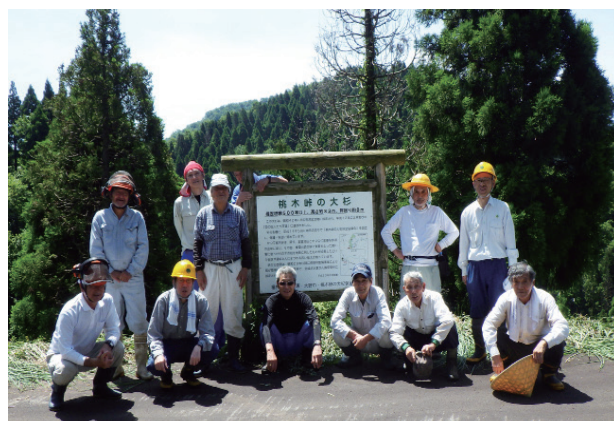
保全作業後の集合写真

福井森林管理署では、今後も協議会と協力し「桃木峠の大杉」を保護・保全するための活動を行っていきます。