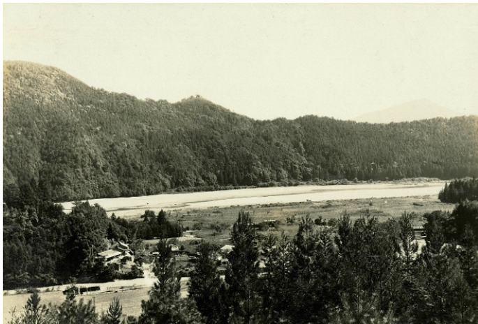
十津川堰から向山国有林を遠望、昭和7年【尾鷲署】