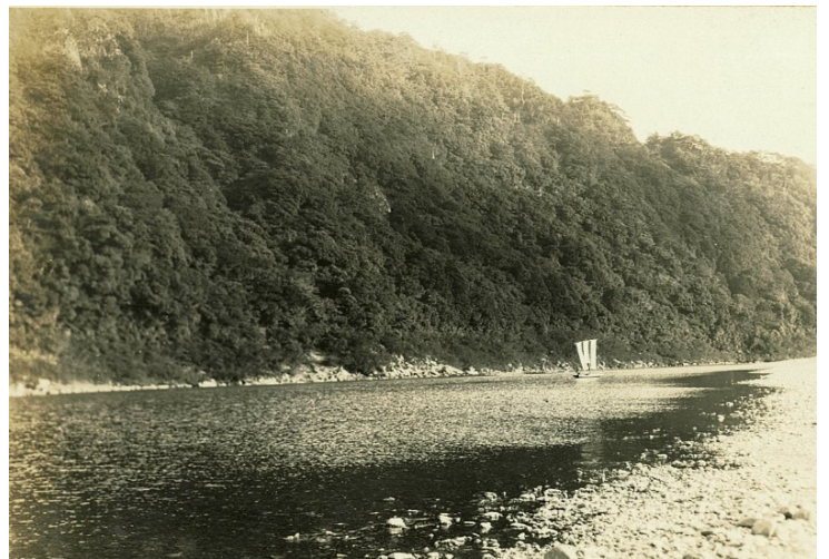
熊野川から眺める権現山国有林、昭和7年【田辺署】