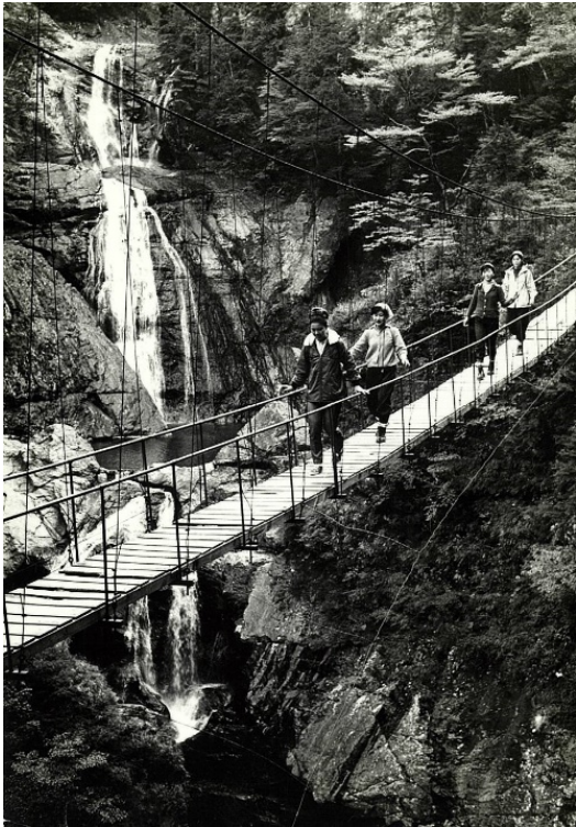
七ツ釜滝とつり橋、大杉谷【尾鷲署】