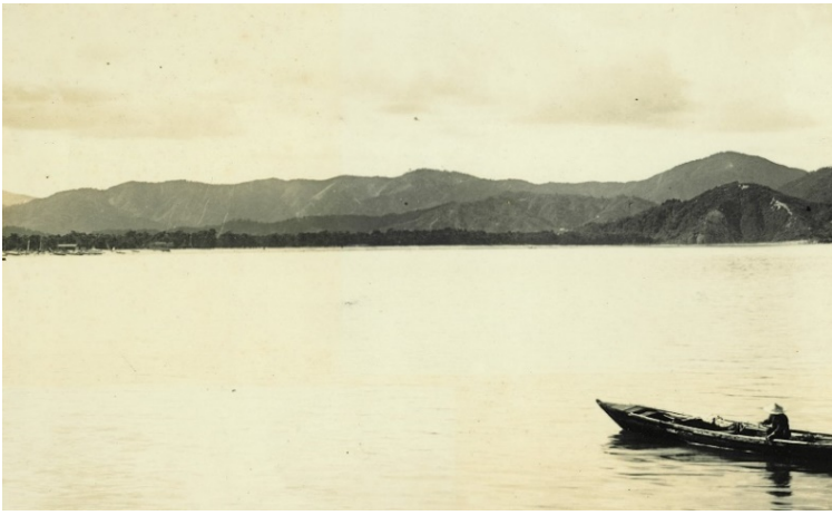
松原国有林遠望、昭和7年【敦賀署】