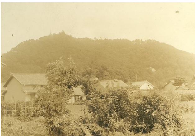
安土城と安土山国有林、蒲生郡安土村 昭和7年【大津署】