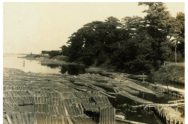
大濱国有林、貯木池の材は民材、昭和7年【尾鷲署】