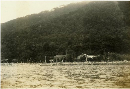
白髪神社と宮ノ前国有林、滋賀郡小松村 昭和7年【大津署】