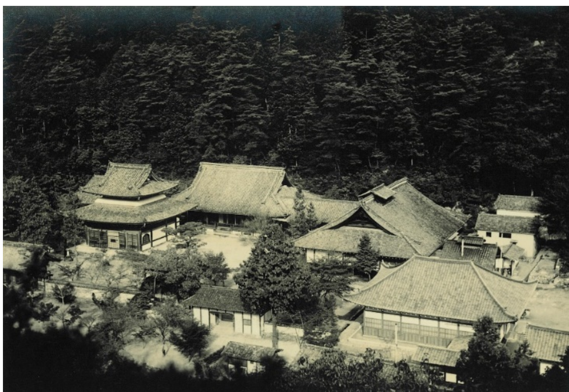
佛通寺と佛通寺山国有林、豊田郡高坂村、昭和7年【西条署】