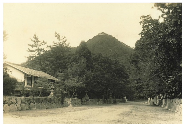
古城山国有林、蒲生郡八幡村 昭和7年【大津署】