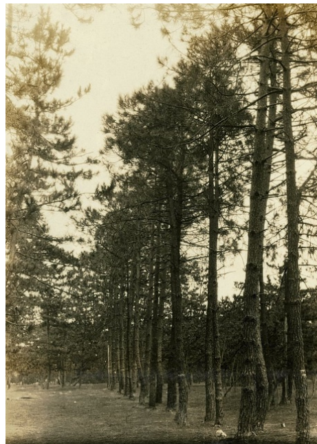
安宅国有林、防風保安林安宅町、昭和7年【大聖寺署】