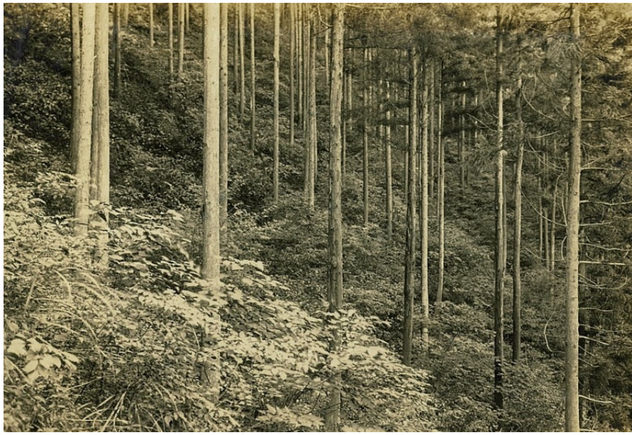
貴船山国有林、昭和7年【京都署】