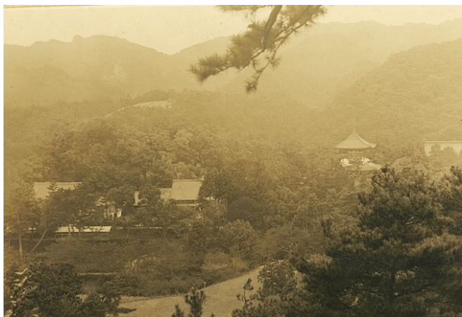
根来山国有林と根来寺、昭和7年【高野署】