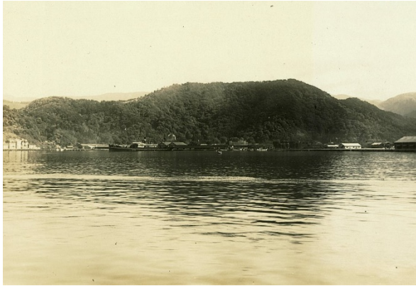
天筒山国有林【敦賀署】