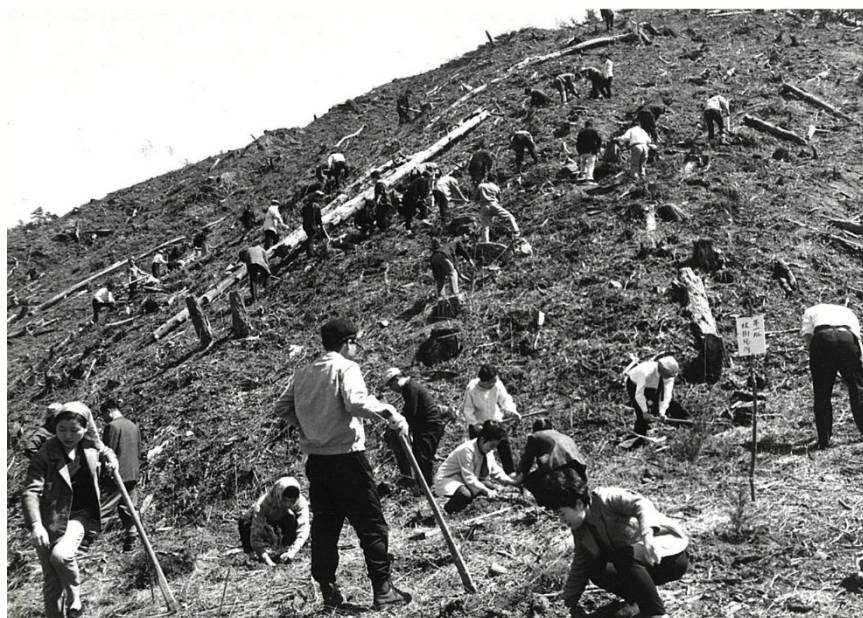
箕面山国有林における紀元百周年植樹祭【神戸署】