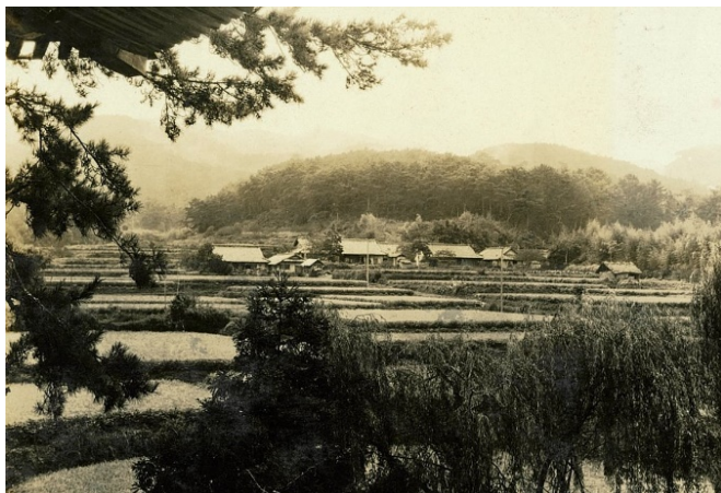
根来寺山門楼閣から見た国有林、昭和7年【高野署】