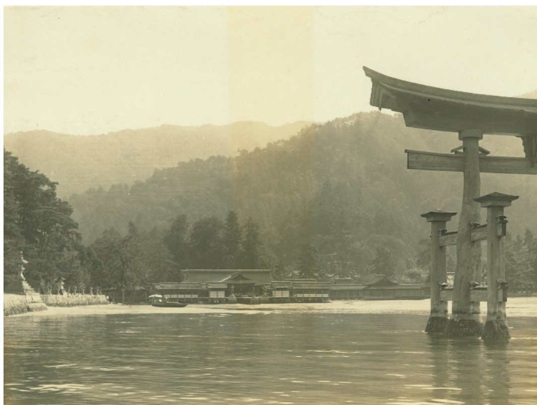
巖島国有林、昭和7年【広島署】