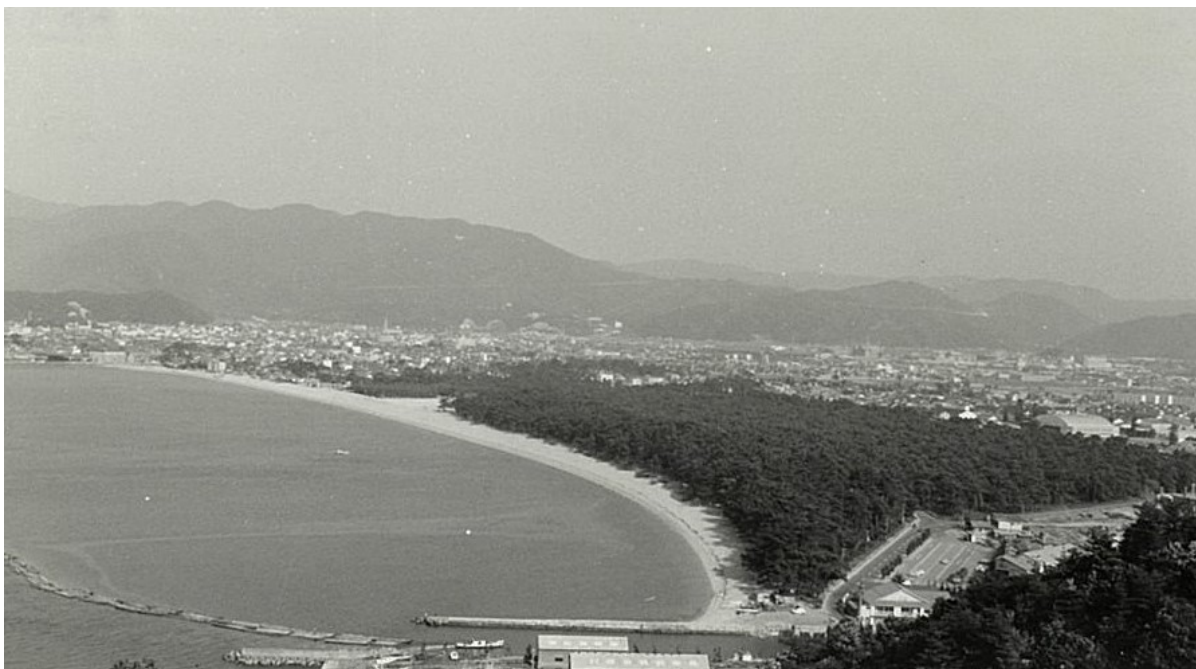
名勝「気比の松原」と敦賀湾【敦賀署】