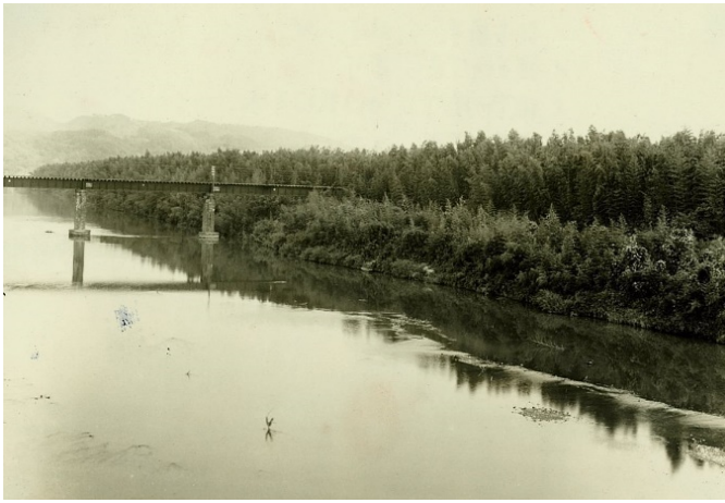
溪畔林、御立藪国有林【京都署】