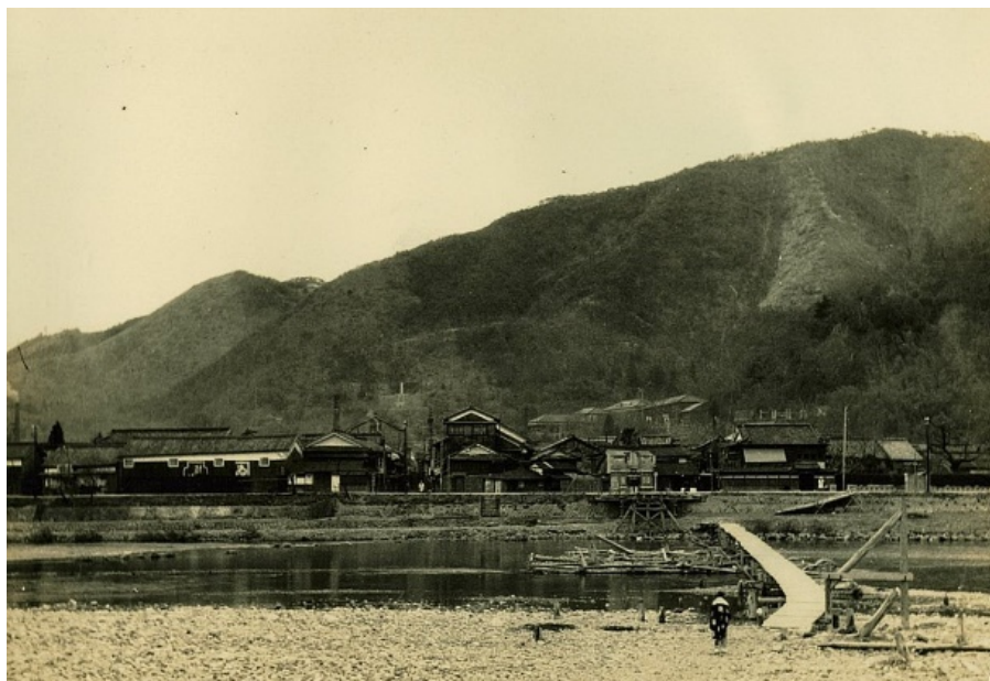
書字山国有林【姫路署】