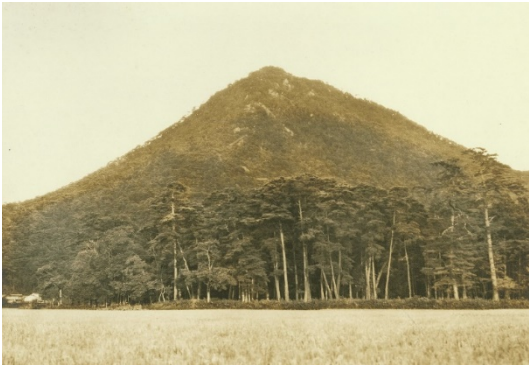
三上山国有林、野洲郡三上村 昭和7年【大津署】