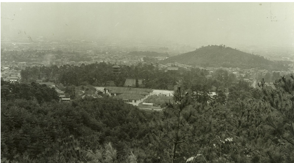
住吉山から見た仁和寺 【京都署】