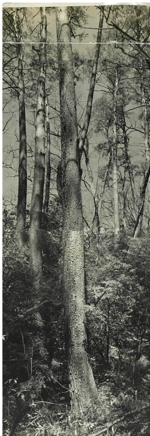
滑マツ、滑山国有林16林班 昭和34年【山口署】