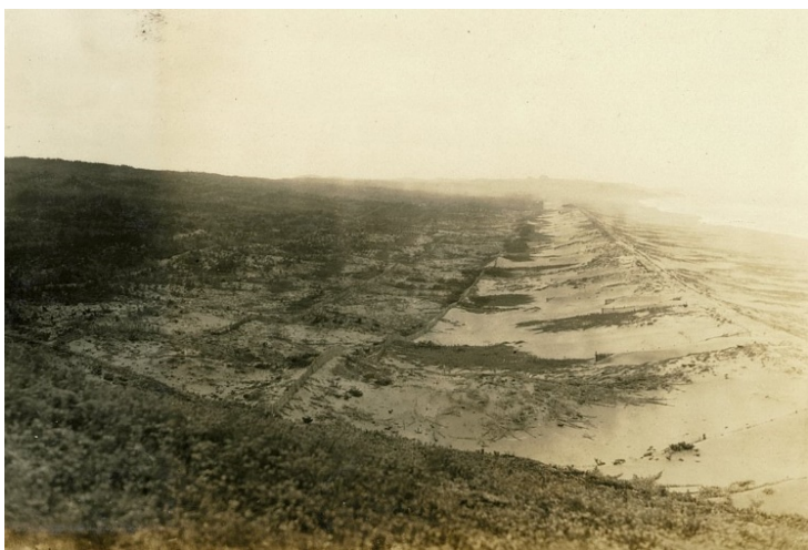
砂浜国有林、塩谷村、昭和7年【大聖寺署】