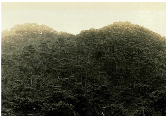
稻荷山国有林、昭和7年【京都署】