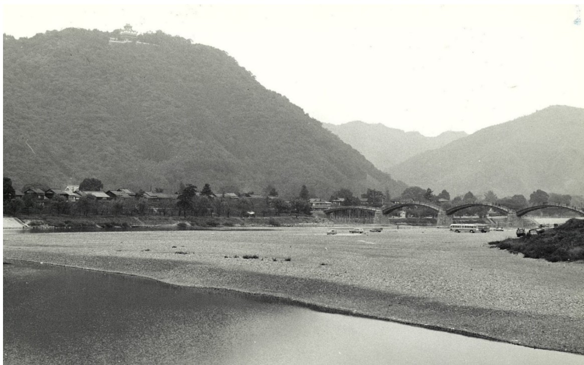
城山国有林と錦川【山口署】