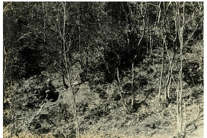
ウバメガン択伐林、老齢木を択伐して萌芽で更新 昭和7年【田辺署】