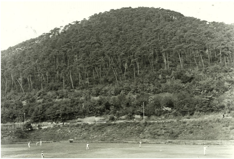
衣笠山国有林【京都署】