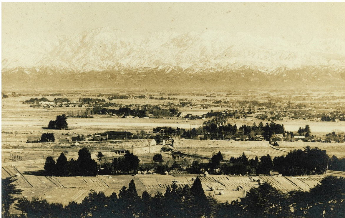
立山連峰、大正15年【富山署】