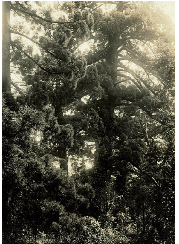
古城山の三本杉、蒲生郡八幡村、推定300年 昭和7年【大津署】