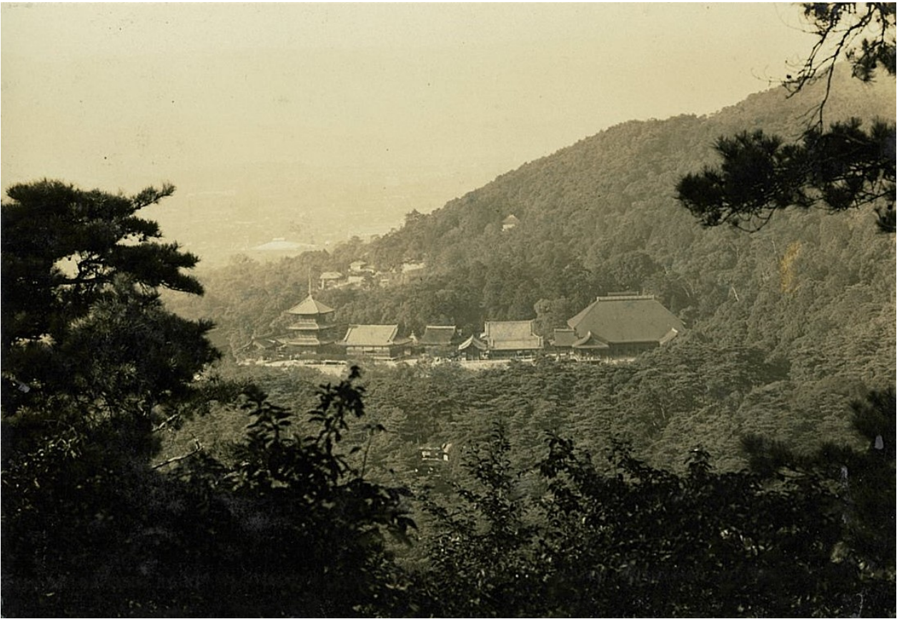
阿弥陀峯頂上から見た清水寺、清水山、昭和7年【京都署】