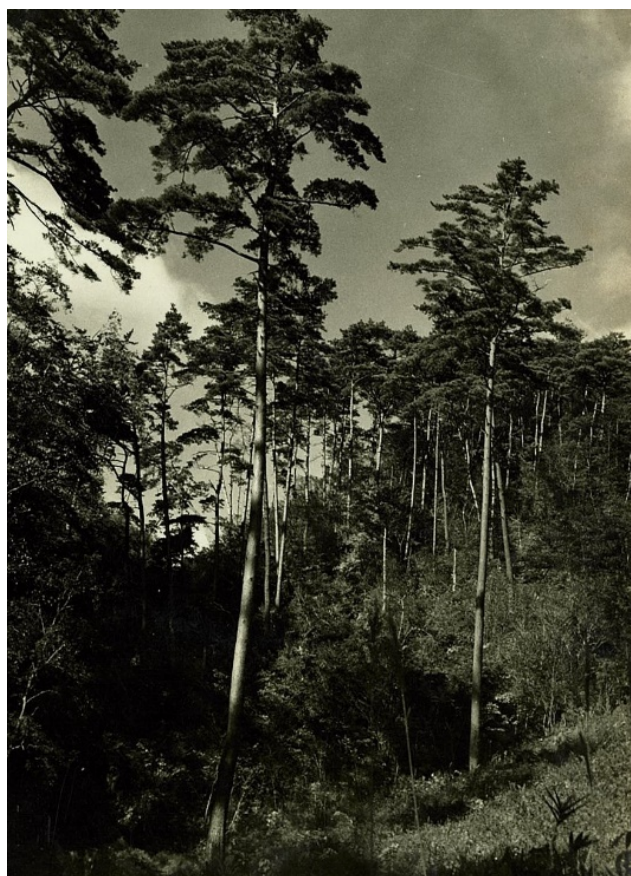
箕面山国有林のアカマツ林【神戸署】