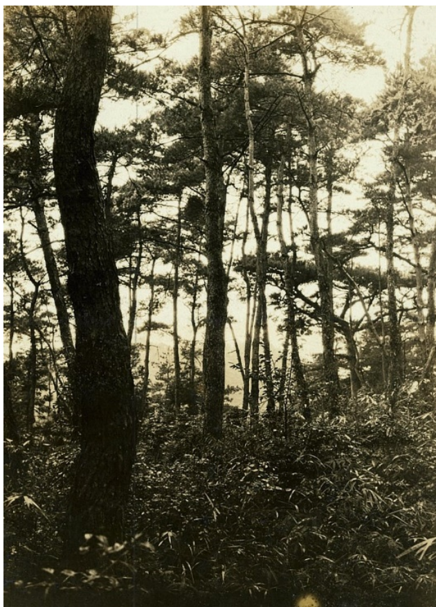
根来山の林相、壮齡のアカマツ林で良質の松茸が自生、昭和7年【高野署】