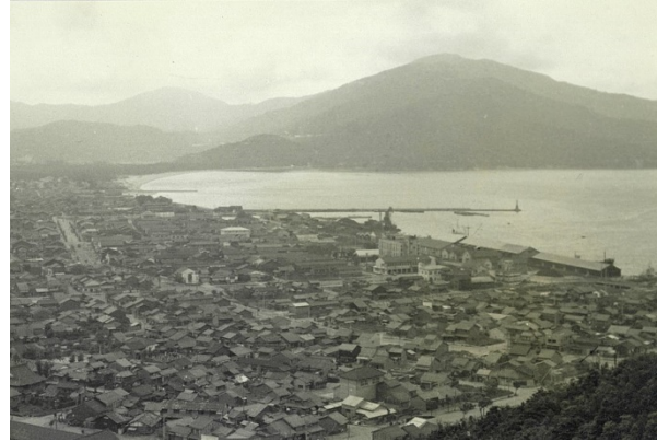
天筒山国有林から見た敦賀市街【敦賀署】