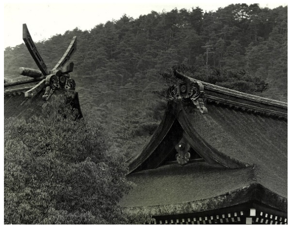
檀原神宮と畝傍山国有林【奈良署】