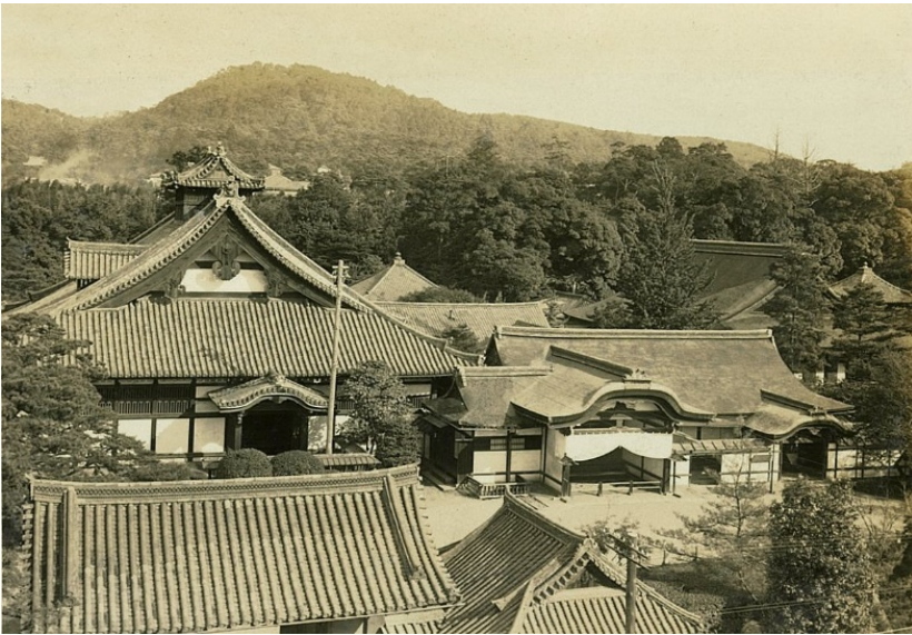
東山区役所から見た妙法院、阿弥陀峯 昭和7年【京都署】