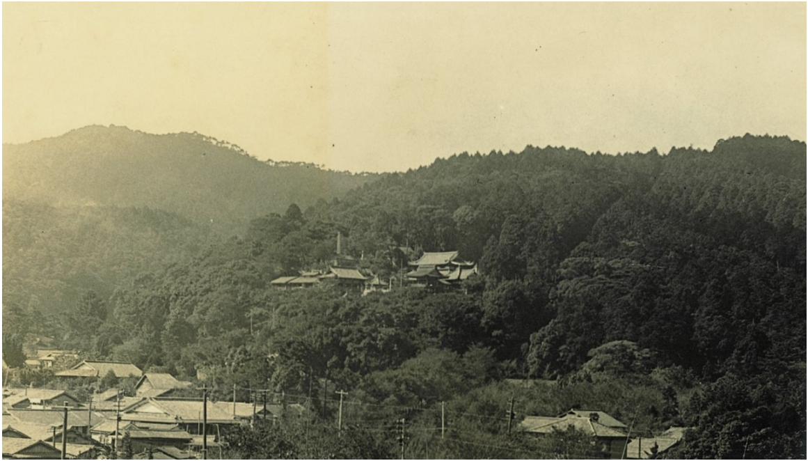
三井寺と別所国有林、大津市、昭和7年【大津署】