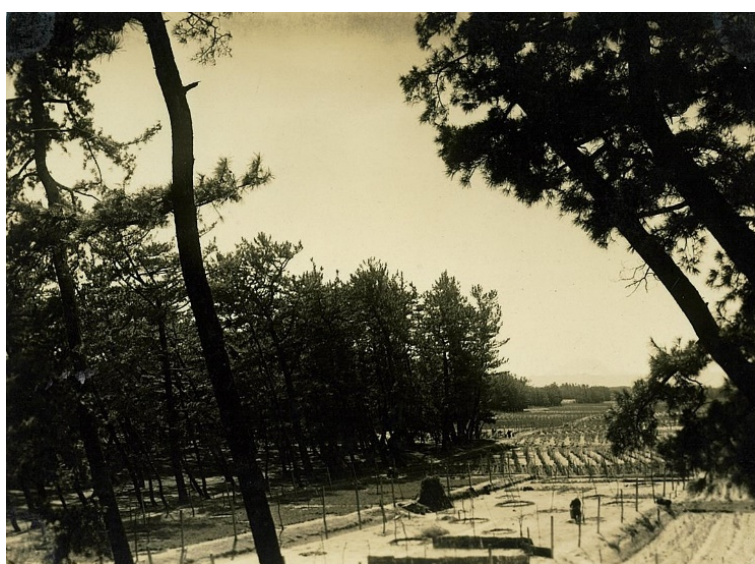
防風林、簸川郡大社町海岸国有林 昭和7年【島根署】