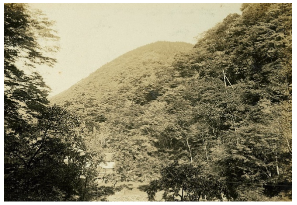
鞍馬山・天狗谷、貴船山国有林、昭和7年【京都署】