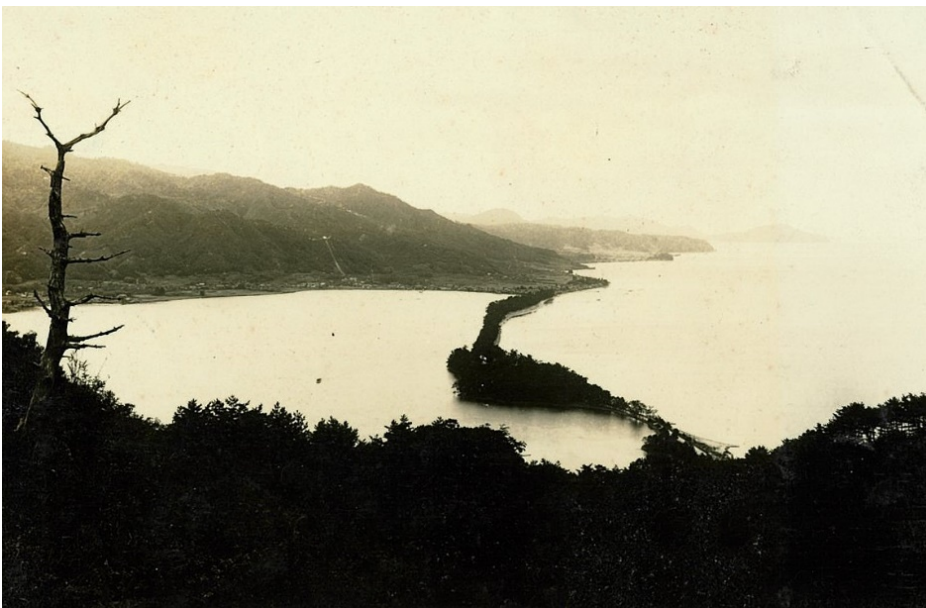
須津山国有林から見た天橋立 昭和7年【敦賀署】