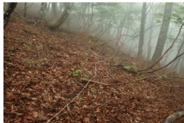
モニタリング調査の概要