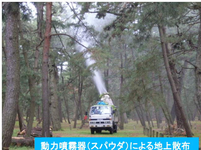
動力噴霧器(スパウダ)による地上散布