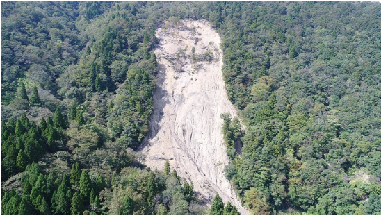
ドローンを活用した崩壊地調査

災害地の調査などICT等を活用し職員自ら行っており、迅速な情報収集・対応の実施をしています。