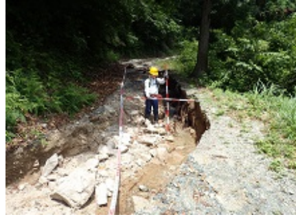
林道被災状況調査