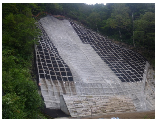
山腹工（籠掛国有林）