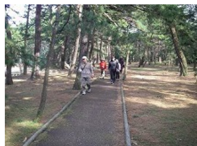
バリアフリー遊歩道の整備