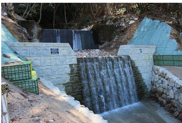
溪間工（黒河山国有林）