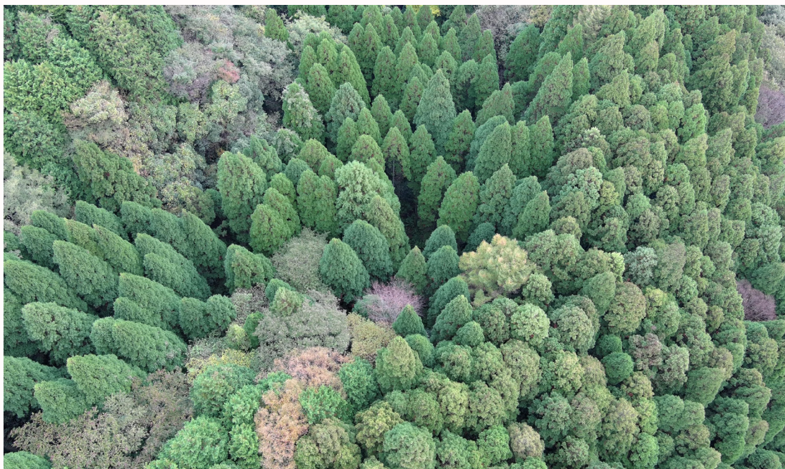
公開動画の一コマ