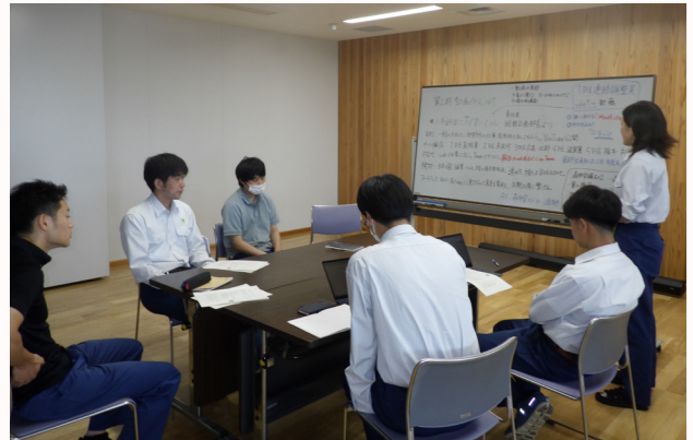
企画会議で多くの提案が出される