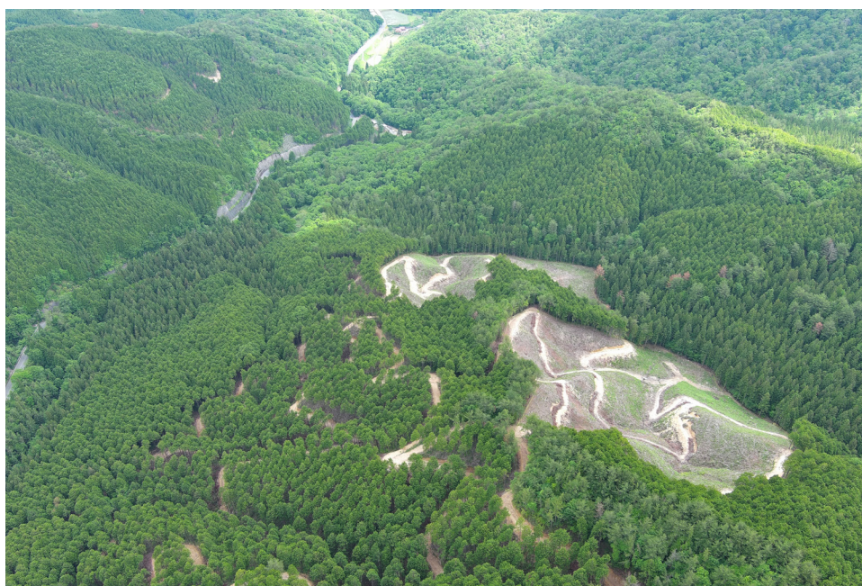
写真①令和5年度生産事業個所（犬伏山国有林）

当事務所の管轄区域の特色は、国有林野事業の中でも木材生産・林業経営に位置づけられる事業が盛んに行われていることが挙げられ、犬伏山国有林 いぬぶせやま （美土里町）・熊谷山国有林 くまたにやま （高宮町）を中心に素材生産事業をはじめ立木販売、造林事業（新植・下刈など）といった各種事業を展開しています。