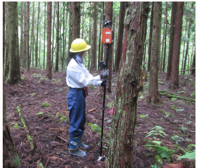
3Dレーザスキャナで計測中

林業とは縁もゆかりもない高校を卒業したため、周囲に置いていかれるのではないかと入庁時には一抹の不安を覚えました。しかし、研修で基礎の基礎から教えていただけるため、林業知識ゼロの私でも安心でした。見聞きすること全てが新鮮なので、むしろ経験のない方こそ楽しめるのではないかと思います。