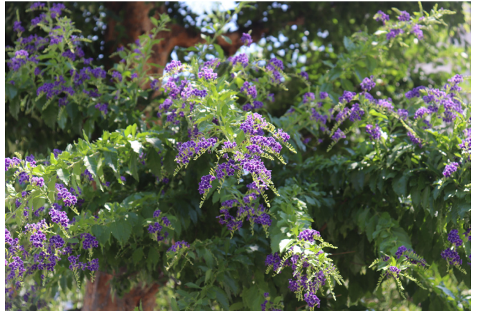
大阪市内の公園で見つけた台湾レンギョウ花です

デュランタ（台湾レンギョウ）は、クマツヅラ科ハリマツリ属（デュランタ属）の常緑性花木です。別名ハリマツリといいます。原産地は、北アメリカ南東やブラジル、西インド諸島などで、熱帯性植物のため、暑さに強い一方で寒さにはやや弱い性質です。ただし暖地なら戸外でも越冬でき、大阪市内では公園等でも見かけます。開花する期間が長く（6から9月）、垂れ下がる花茎に径1cmほどの紫色の花を房状につけ、次から次に開花します。花の後には愛らしいオレンジ色の実を鈴なりにつけますが、毒があるので、幼児やペットが誤って口に入れることのないように気を付けてください。樹高は30～200cmの低木で、剪定によって樹高をコントロールすることができます。