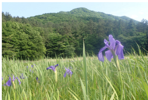
三瓶山とカキツバタ【5月撮影】

とで姫逃池やカキツバタ保全への関心を高めてもらうこと、関係団体で協力して行うことで団体間の親和を図ることを目指しています。