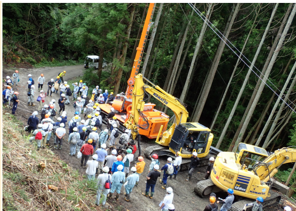
岡山署：一貫作業箇所（天木山国有林）