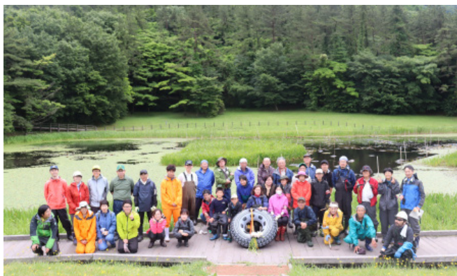
参加者約50名の集合写真