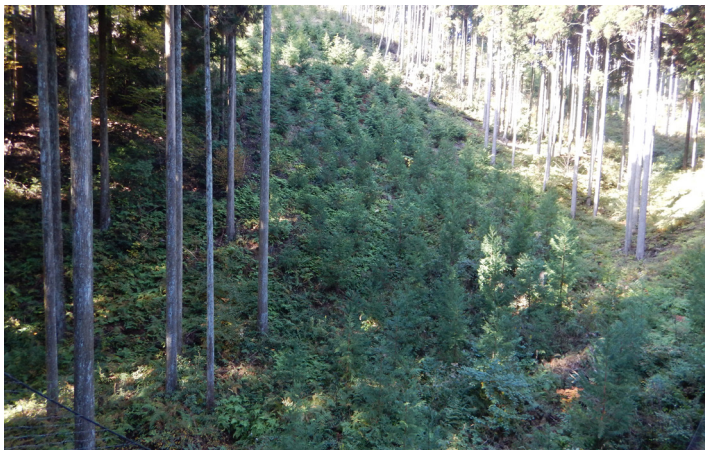
三重署：下刈実施箇所（ ごんゆうだに 悟入谷国有林）

造林の省力化として、雑草木との競合状態を見極めながら下刈の回数を削減するとともに、秋冬に下刈を実施することで、作業員の負荷軽減や労働安全性向上につながることを期待されていることを紹介しました。