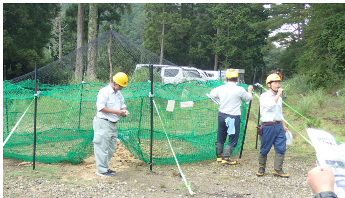
和歌山署：円形ワナ（ にしのごう 西ノ河国有林）

和歌山県南部の国有林内で、新たに安価で軽いイノシシ用の円形ネット式囲いワナを改良したシカ用円形ワナの実証を行ったことから、その改良点（①上部ネットの追加、②アーチ状入口の設置、③ネットと支柱を留め金具で固定）や、円形ワナのメリット（①安全な止め刺しが可能となったこと、②捕獲したシカが傷つかないことでジビエ利用に有効であること）などを紹介しました。