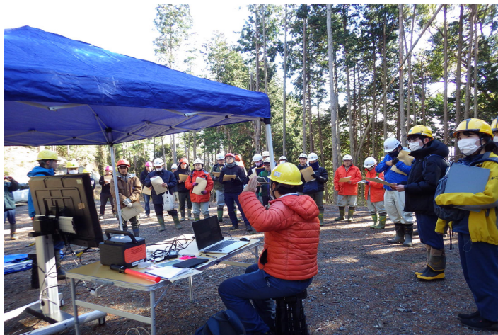
滋賀署：現地検討会（奥島山国有林）

また、このような取組について、民有林への普及を念頭に置き、各森林管理署等で現地検討会を実施し、昨年度は、延べ392名の民有林関係者に参加いただいています。