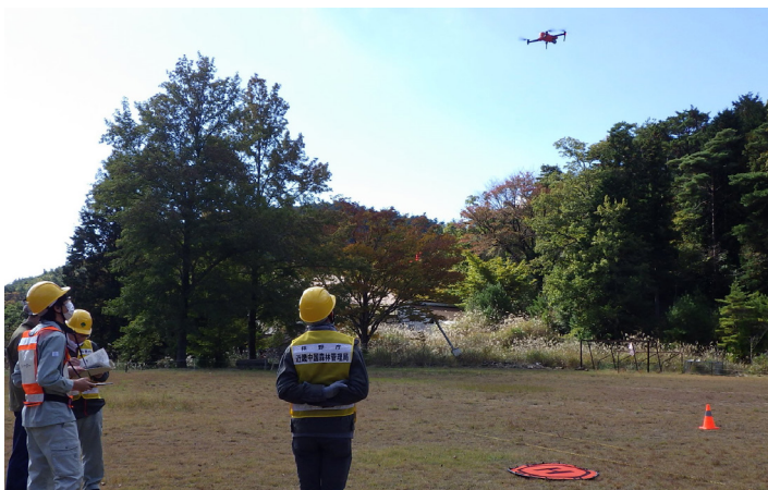
局：ドローン操作技術者育成研修（大阪府能勢町）

近畿中国森林管理局では、民有林の人材育成支援の取組として、職員研修を活用した市町村林務担当職員の技術習得として「市町村林務担当者実務研修」を令和4年度から実施しています。令和5年度は、森林・林業の基礎研修（森林の見方・森林の育成・森林の収穫）、ドローン操作技術者育成研修に市町村の林務担当者10名が参加しました。