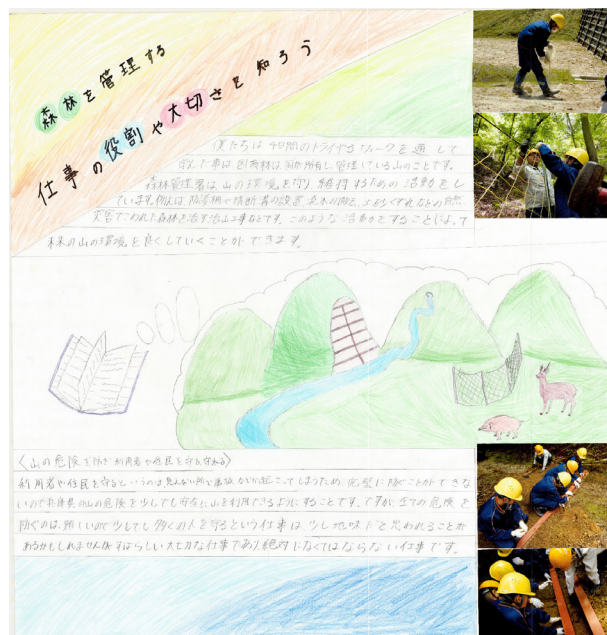
生徒達が作った国有林PRポスター

今回の職場体験を通じて、森林や林業への興味関心が高まるとともに、生徒一人ひとりが働く意義について学習するきっかけになることを願っています。