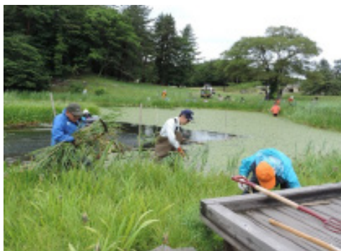
池の中に入り競合種を取り除く作業

当日の作業では、カキツバタの競合種となるヨシやススキ、ネザサ、セイヨウスイレンなどを除去しました。