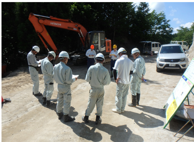
林道災害復旧工事箇所での安全パトロール

岡山森林管理署では請負事業体等の労働災害防止に資するため、6月以降、造林、素材生産、治山、林道の各事業、立木販売、樹木採取権箇所において、署長による請負事業体等への安全パトロールを実施しました。