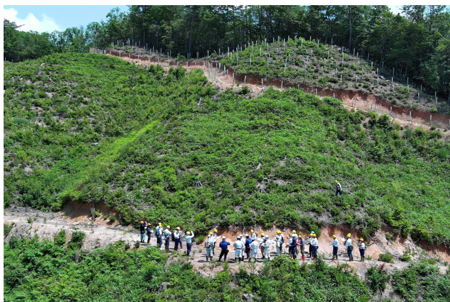
写真②低密度植栽試験地令和6年度現地検討会（時鳥山国有林）

令和5年度には森林整備事業として、保護伐（2.5ha以下の小面積皆伐）と間伐を組み合わせた一体的な施策を実施しました。本事業では木材の生産・販売に加え、保護伐により異なる林齢がモザイク状に配置された森林に導くとともに、間伐によって林内の光環境を改善し、豊かな下層植生に誘導するといった公益的機能の発揮に向けた森林整備に取り組みました（写真①）。