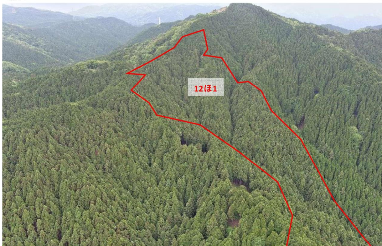
赤坂国有林12ほ1林小班 ドローンにより撮影